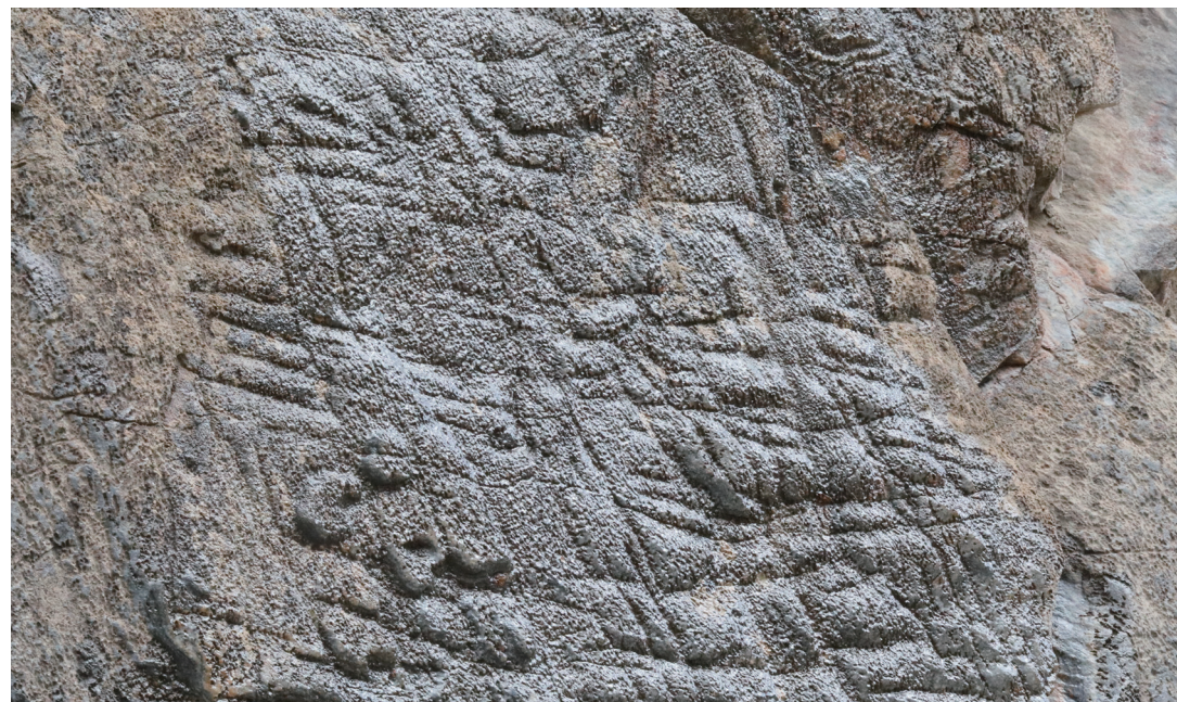
3号岩画上的刻画痕迹及人像