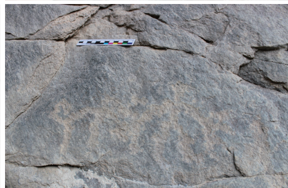
2号岩画上的狩猎图案