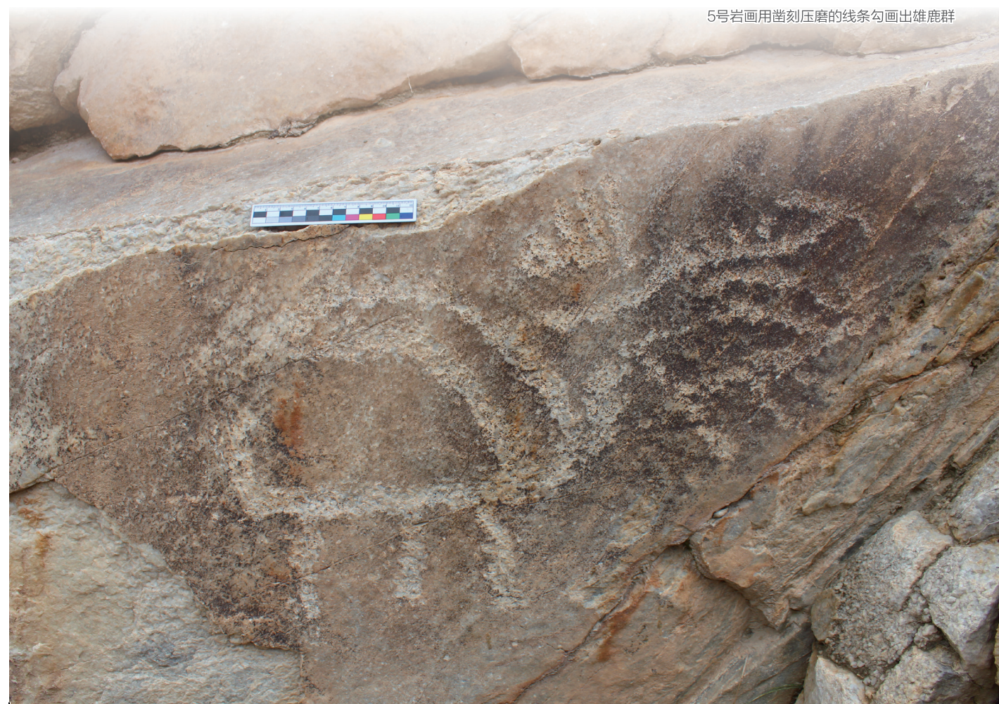
5号岩画用凿刻压磨的线条勾画出雄鹿群