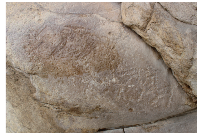
1号岩画，可辨明马、鹿形象

在第一部分南侧约1米处为骑马牧猎图，距离地面2.5~2.8米，画幅高约0.6米，宽约0.3米，画面凿刻压磨而成。其表现力强劲，突出了牧猎人的威武。骑马者左上方为一头比马更大的雄