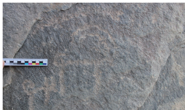
2号岩画上的北山羊、盘羊图案