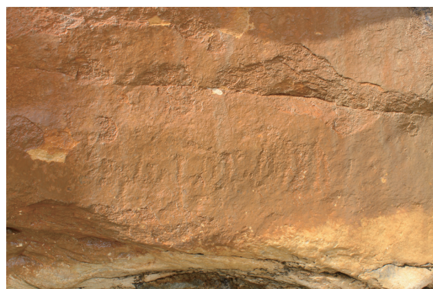
4号岩画第四部分(西侧岩画)马形图案

第一部分在最东侧,符号性质不明,左右对称,推测是双鹰图形符号。这部分凿刻线条清晰明显,可能是比较晚的创作。其下近水面处有米字形符号,由4条交叉的直线组成,性质不明。第二部分由北山羊、马等动物形象组成,其中一匹马上有明显的骑乘者。该部分左侧可见2个明显的北山羊形象,左上角北山羊保存最为完好清晰,头向右,身长15厘米。该画像左下方有另