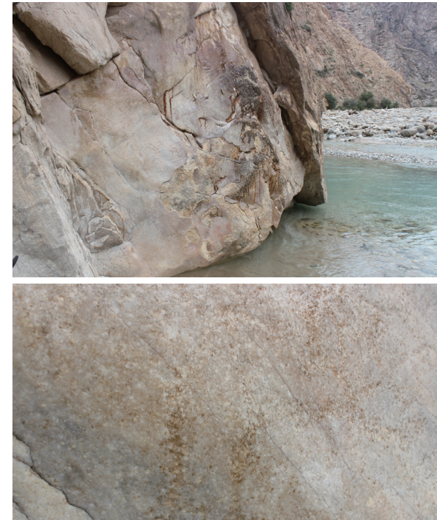
1号岩画上的人像

2.0米，宽约1.2米。中部有北山羊，左下部有人像图案。两个人像并列，均为凿磨而成。该画幅上部风化严重，已模糊不清，但可辨识出北山羊形象。画幅下部有两处掌印，手掌轮廓用梯形表现，手指则用直线表现，风格简约，凿刻形成的凹槽已被流水侵蚀光滑。