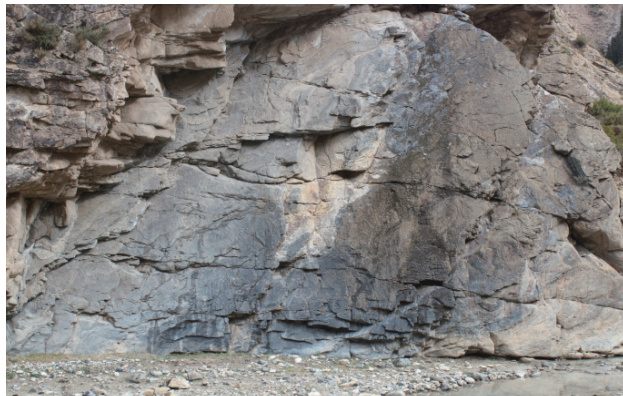
希尔维克培岩画（2、3号岩画）全景