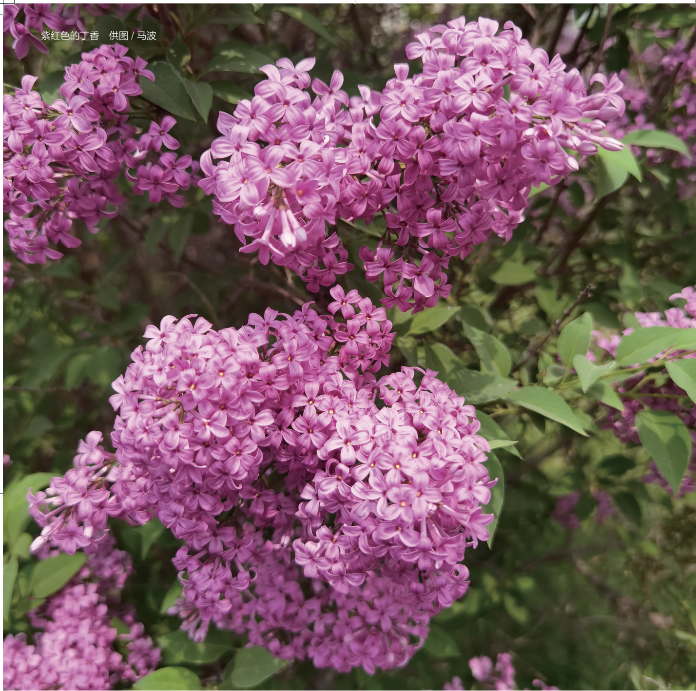
紫红色的丁香