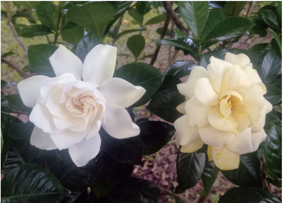
白蟪 供图 / 文彬