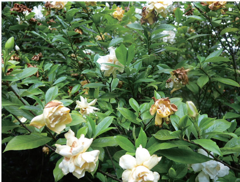
大花栀子