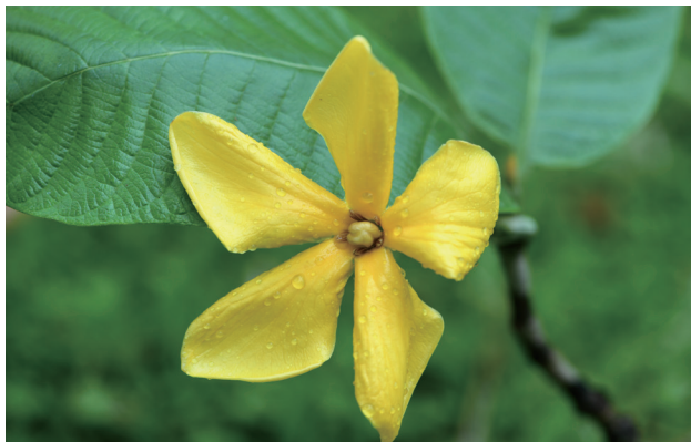
大黄栀子花