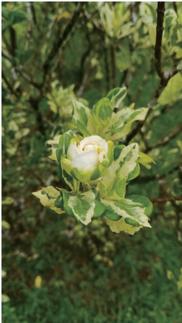
花叶白蟾