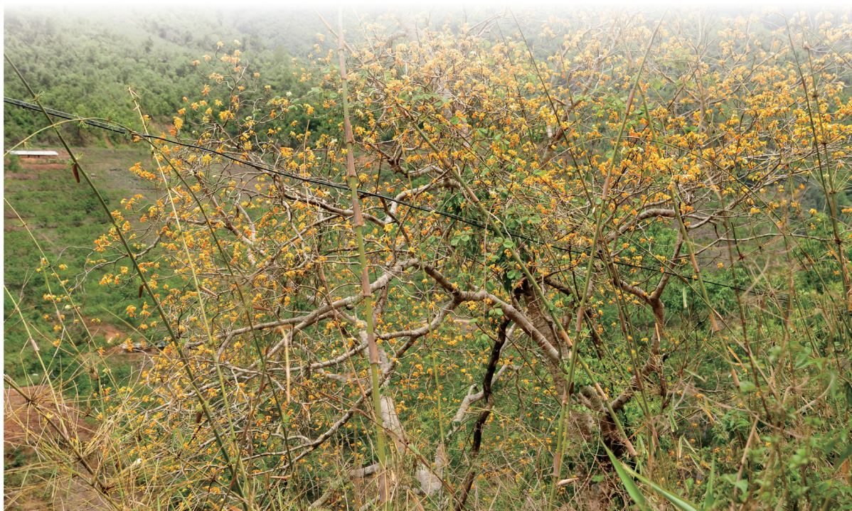
开满花的大黄栀子

该植物具有很高的园林观赏价值，其叶、花、果实和种子可供药用，果实又是提取食用黄色素的优质原料。这种小乔木，其叶片大、分枝高，既能够给庭院适当的遮阴，又不挤占庭院下层的空间，开花时节还能给环境中增添自然的芬芳，特别适合在农家庭园里种植。