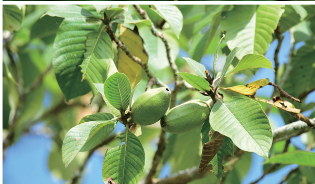
大黄栀子的果实