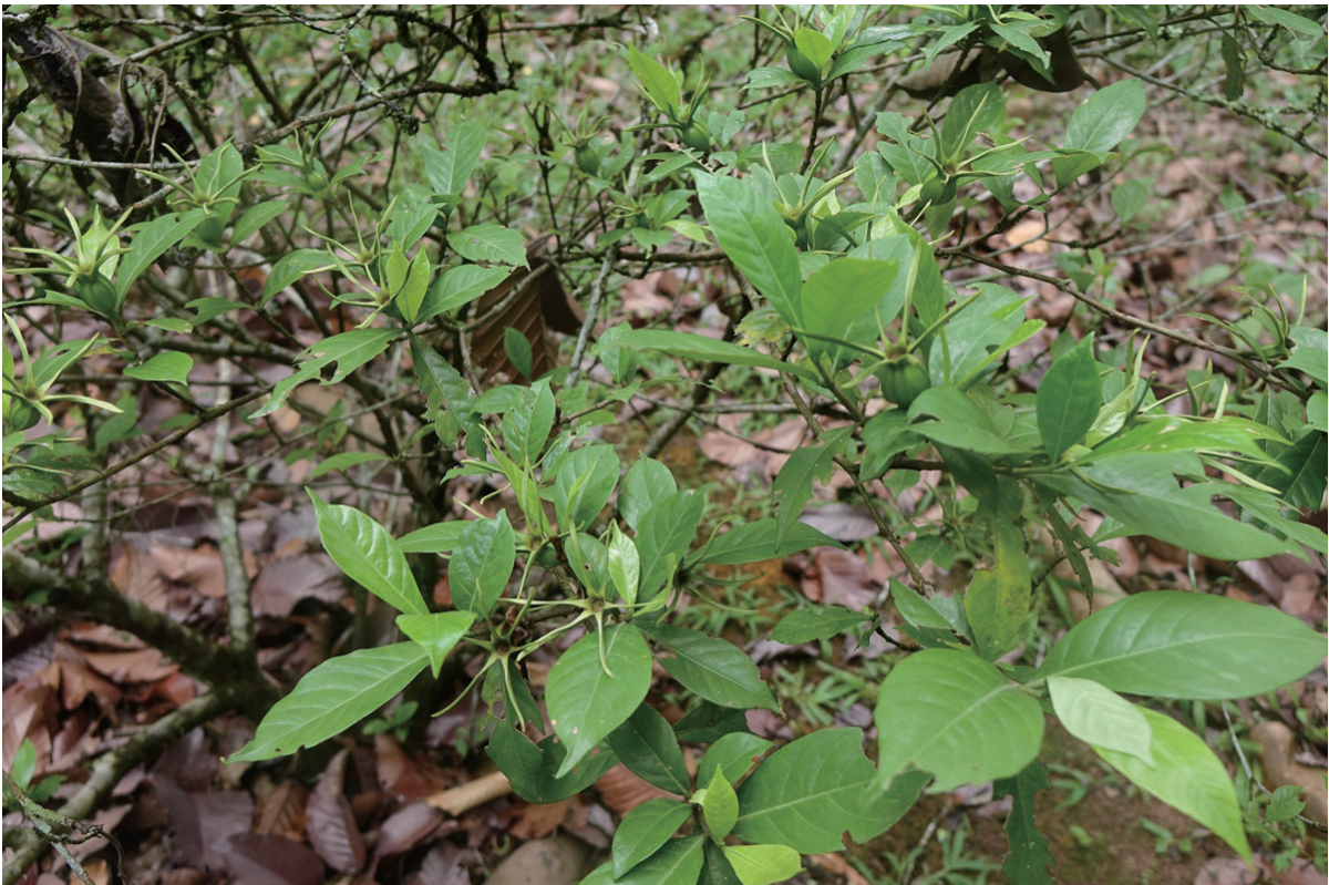
海南梔子

的顶部，无花梗或花梗极短；萼管倒圆锥形，具棱；花冠管长1.3~1.5厘米，由基部向上逐渐扩大，顶部6裂，裂片长圆形，长1.5厘米，顶端钝。产于海南崖县和东方；生于山坡或山谷的