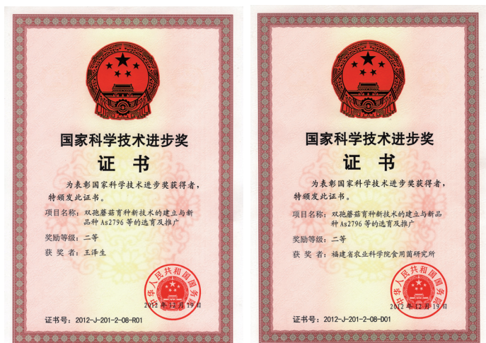
国家科学技术进步奖二等奖获奖证书

食用菌研究所、上海市农业科学院、浙江省农业科学院园艺研究所、四川省农业科学院土壤肥料研究所、华中农业大学和甘肃省农业科学院蔬菜研究所6个单位的科研人员,在国家攻关项目的基础上,继续开展跨地域的技术合作,收集和共享种质资源,研究和共享创新育种技术,重组种质的高产与优质等重要性状,选育有自主知识产权的新品种,研制关键配套技术和生产模式,联合推广新品种。历时25年,取得系列成果,将我国双孢蘑菇年产量从15万吨提高到237万吨,实现了我国双孢蘑菇产业从小到世界第一的跨越式发展。