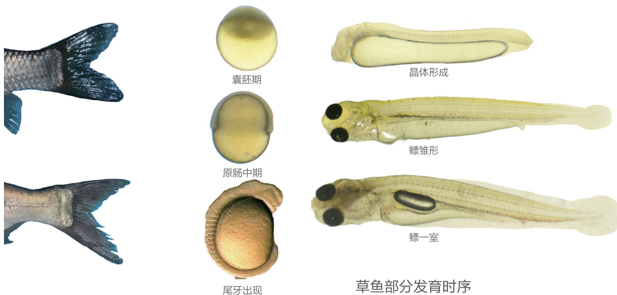
草鱼部分发育时序

根据四大家鱼在长江干流繁殖时的水温，长江中四大家鱼从受精到孵化大致需要32~36小时，而发育至有一定游泳能力的鳃一室期需132~144小时，到转向完全外源营养期的卵黄吸尽期需168~180小时，可见四大家鱼早期生活史阶段最少6~7天都处于随水流漂流扩散的过程。结合其随水流漂流扩散的特征，我国自唐宋时期起在长江流域就形成了捕捞四大家鱼鱼苗的产业，这种生产作业方式一直延续到现在，是支撑我国四大家鱼养殖业发展壮大的基础。