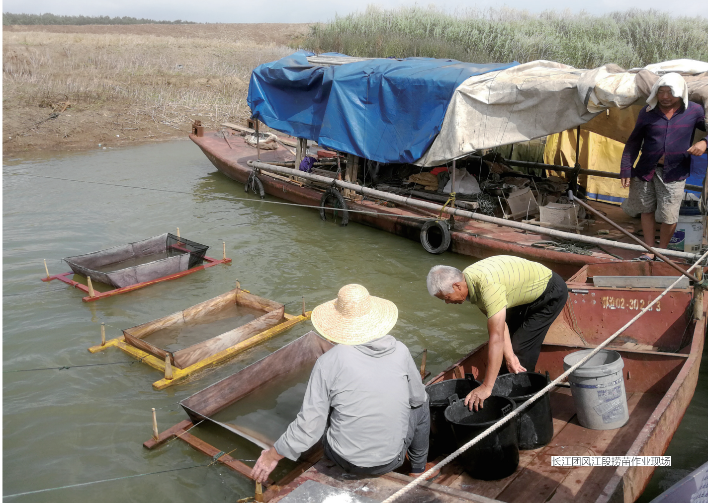
长江团风江段捞苗作业现场

里的长江干流上，分布有四大家鱼产卵场共36处，产卵场范围累计707公里，1964—1965年干流年均总产卵规模达1150亿粒。在此基础上，还形成了较成熟的四大家鱼早期资源采样技术、产卵场推算及产卵规模计算方法、较完整的四大家鱼早期阶段形态识别特征资料，确定了四大家鱼产卵与水文因子的关系。此外，提出大