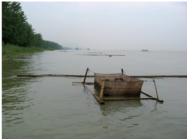
长江瑞昌江段四大家鱼原种场捞苗现场

里的长江干流上，分布有四大家鱼产卵场共36处，产卵场范围累计707公里，1964—1965年干流年均总产卵规模达1150亿粒。在此基础上，还形成了较成熟的四大家鱼早期资源采样技术、产卵场推算及产卵规模计算方法、较完整的四大家鱼早期阶段形态识别特征资料，确定了四大家鱼产卵与水文因子的关系。此外，提出大