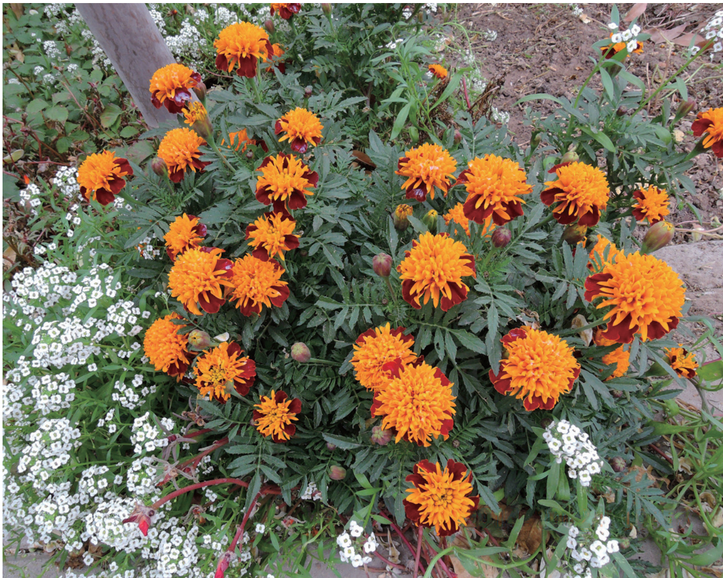
万寿菊鲜花