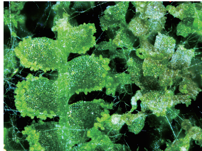
自然生长的芽胞裂萼苔群落

的解释，其中也包含“一种植物”的意思。至此，“藓”字的出现时间，已经提前到了战国晚期至秦始皇时期。