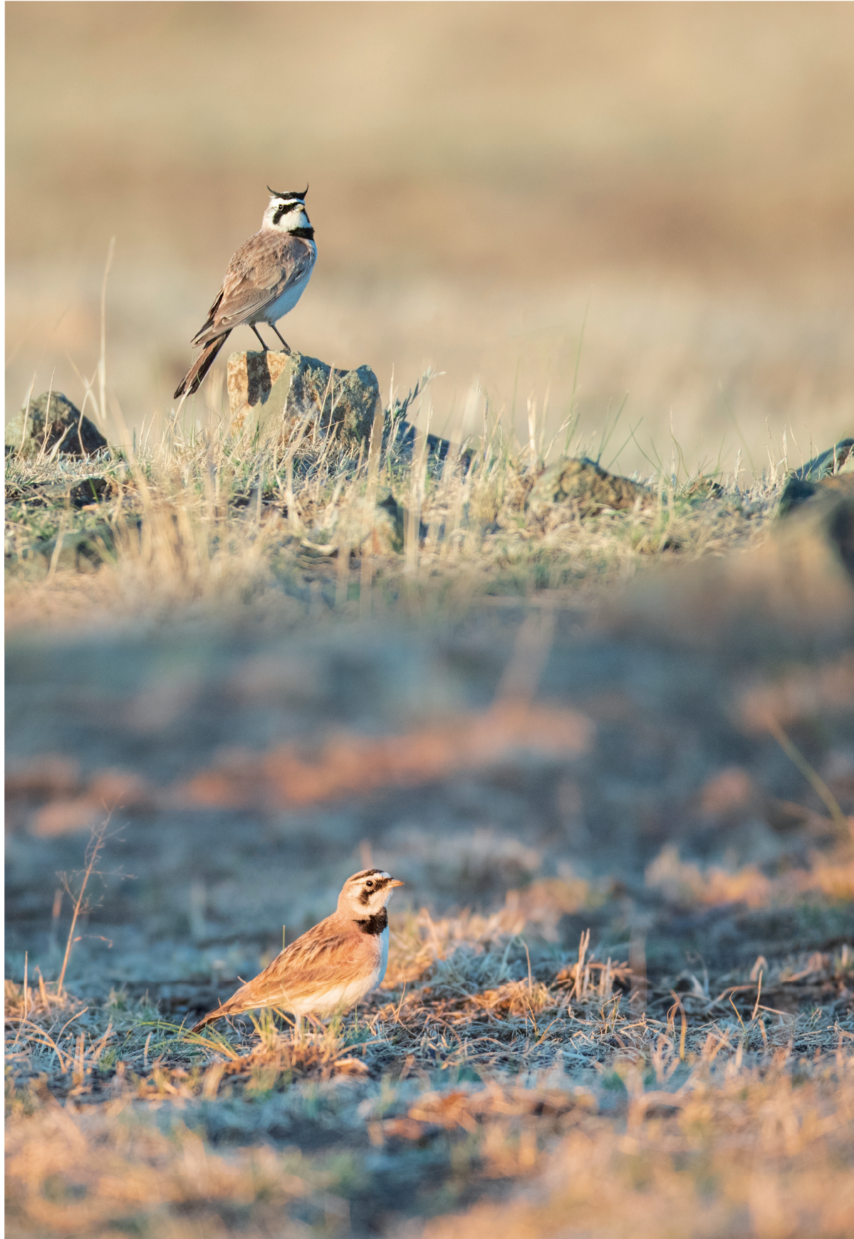
角百灵 (雌鸟)