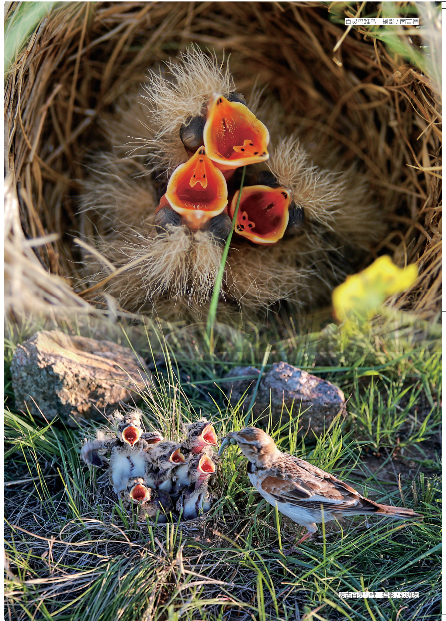
蒙古百灵育雏