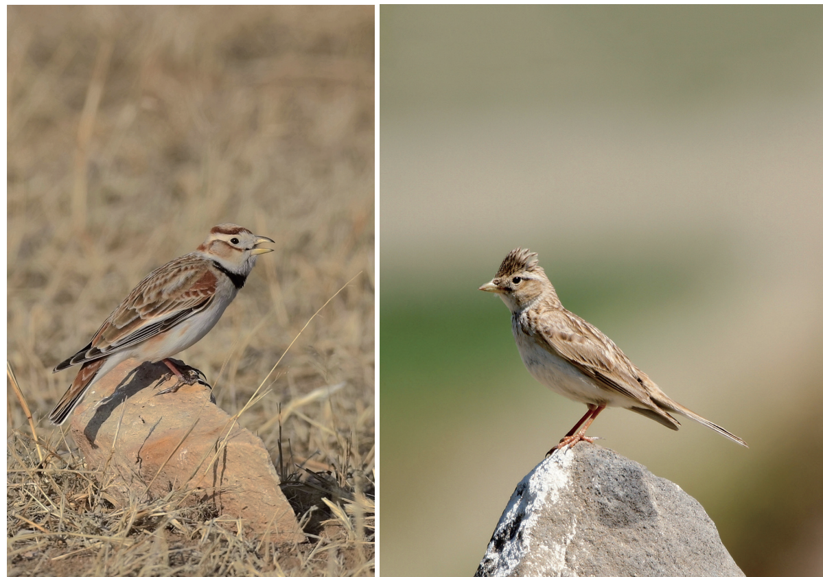
蒙古百灵