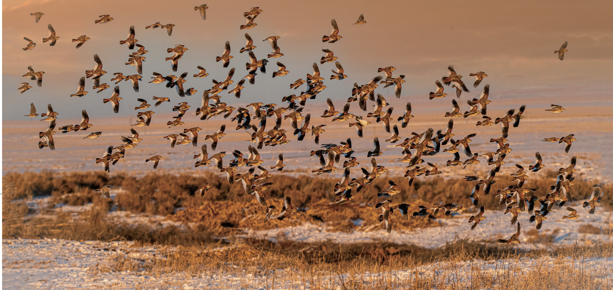
冬季集群的百灵鸟

百灵鸟是草原上代表性鸟类。在内蒙古锡林郭勒地区常见的种类有蒙古百灵、凤头百灵、角百灵、二斑百灵、短趾百灵、大短趾百灵、细嘴短趾百灵和云雀等，特别是蒙古百灵，它是内蒙古自治区的区鸟和锡林浩特市的市鸟。它们遍布全盟各地，栖息于近水的干旱山地、荒漠或草地。其中蒙古百灵以独特的羽色、俊秀的体态、美妙的歌喉，成为它们当中的典型代表。