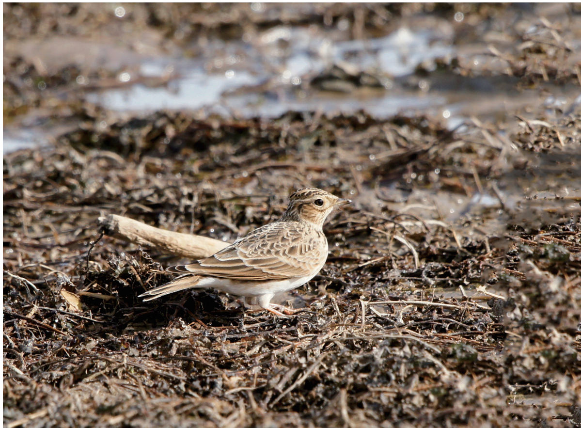
凤头百灵