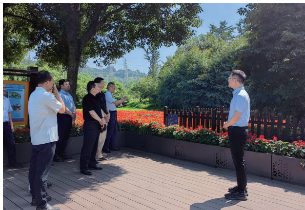
科普宣传 供图 / 禹云超

采用无损检测方式，以珍稀植物地上部分生长与地下部分生长有机结合的平衡机制为导向，无损检测树体断面、叶片等组织，以及利用测肥仪、土壤速测仪等仪器无损检测土壤水分、盐度、pH值、土壤墒情和土壤孔隙度等指标，在对植物不造成损伤的前提下，获得准确的相关指标数据；采用智能化信息化管护方式，建立基