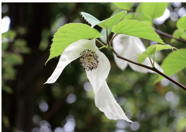
珙桐开花

珍稀植物从原生境到迁入地会因环境条件的变化而导致植物长势较弱甚至难以存活,三峡库区特有珍稀植物存在分布广、跨度大、数量少且全部为野生苗等问题,因此对这些植物开展迁地保护会有较大困难。生物多样性中心针对不同海拔之间植物引种栽培及野外回归适应性较差问题,提出了“双跨越”逐级保护新模式,形成一套特有珍稀植物栽培驯化的技术方法。