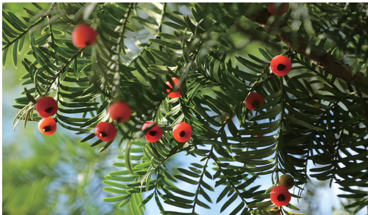
南方红豆杉