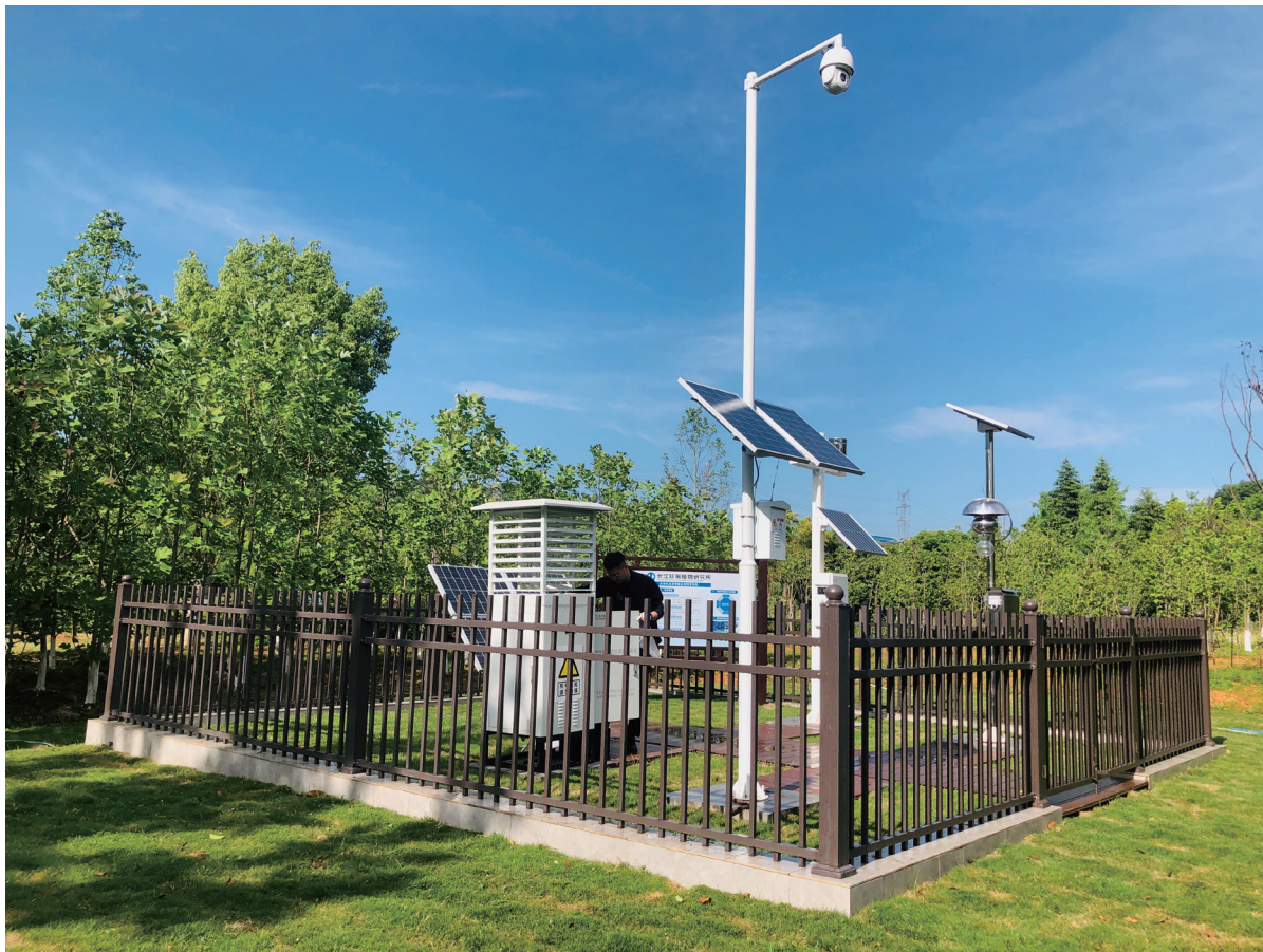
自动化虫害智能监测预警系统

于物联网与图像识别的自动化虫害智能监测预警系统和防控监测体系,系统掌握185平台科研示范区虫害信息,提高虫害监测和防控能力,实现珍稀植物虫害监测预警的信息化管理,根据虫害监测信息数据,能够及时利用物理化学相结合的方法,如采取人工修剪和摘除虫巢、布设