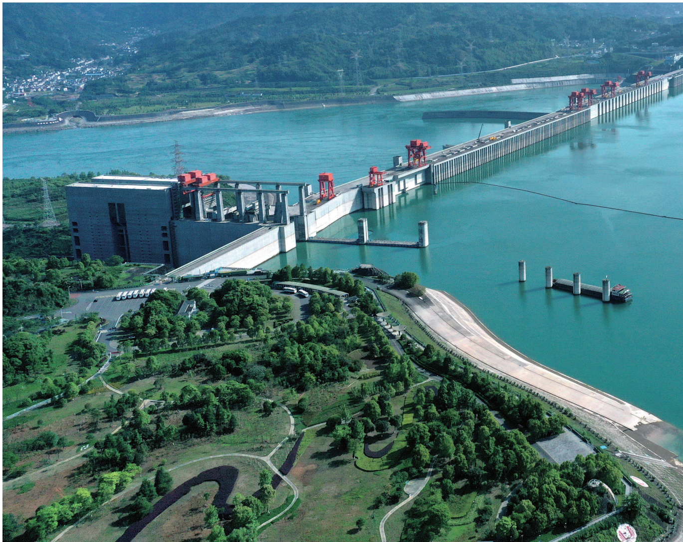
三峡工程左岸185平台科研示范区俯视图