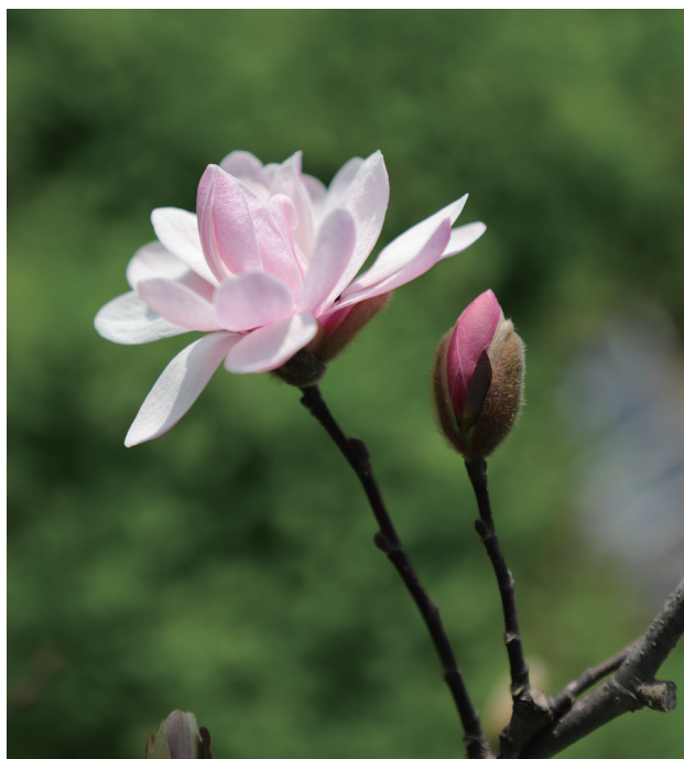
星花木兰 供图 / 长江生物多样性研究中心