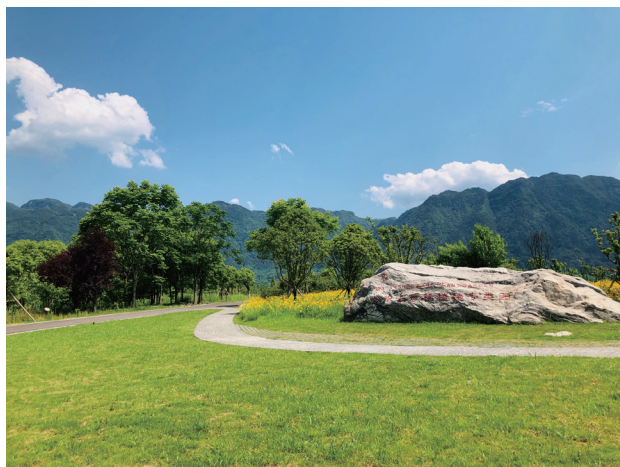
珍稀植物园一角

三峡大坝五级船闸构建五级叠翠生态群落，打造了三峡坝区坛子岭生态公园，规划西园雨污生态修复示范园等，将植物园的建设与三峡大坝、大坝微缩景观、三峡红色基因等元素融为一体。在三峡工程弃渣场原有地形上开展了珍