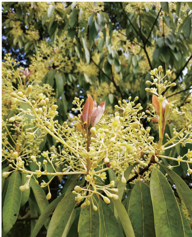
楠木开花