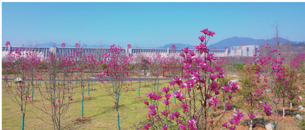
木兰科专类园