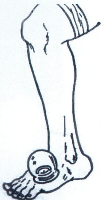
吸吮或解压排毒