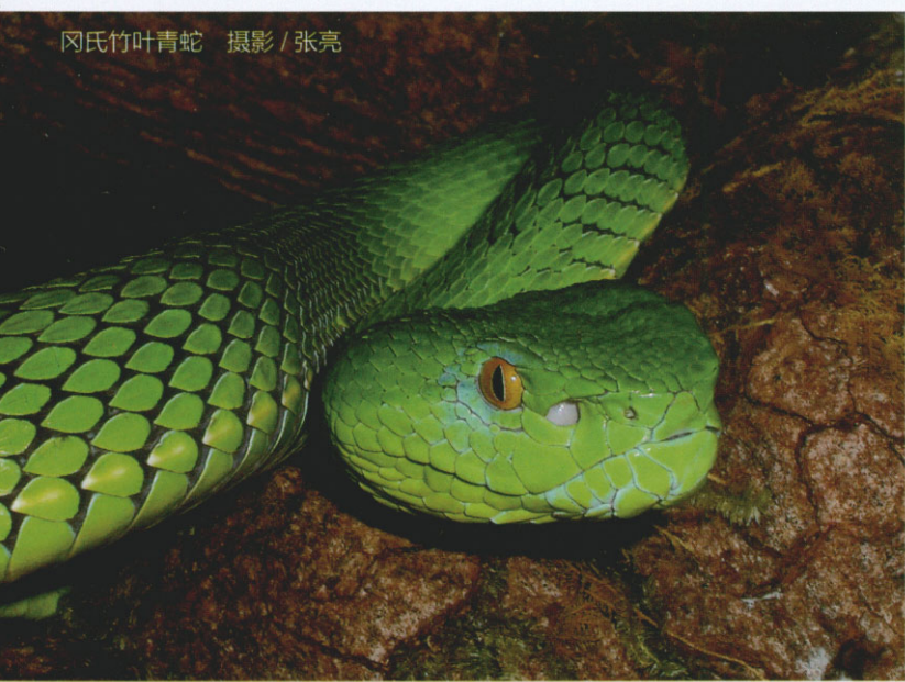
冈氏竹叶青蛇

拍摄某些具攻击性或有毒的蛇类首先要保持安全距离,不管它看上去有多温顺,都不要故意挑衅、玩弄毒蛇。在某种角度来讲,其实毒蛇越好拍,越是无毒的蛇对人的警惕性越高,胆子