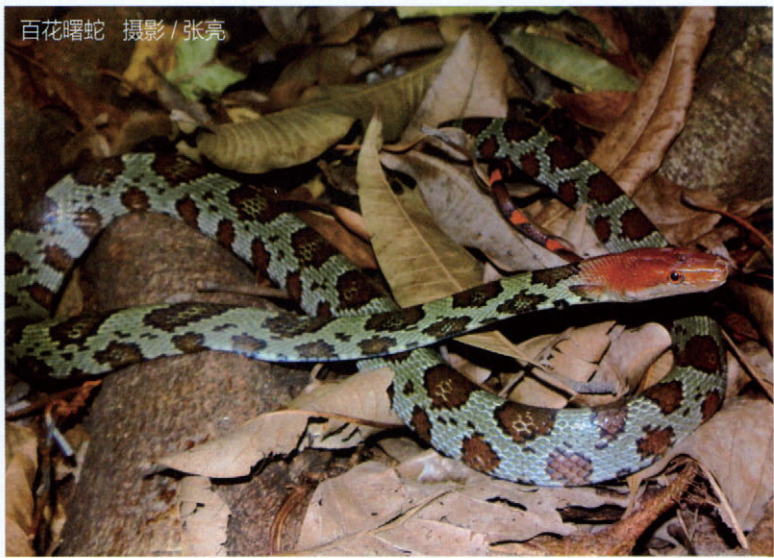
百花曙蛇