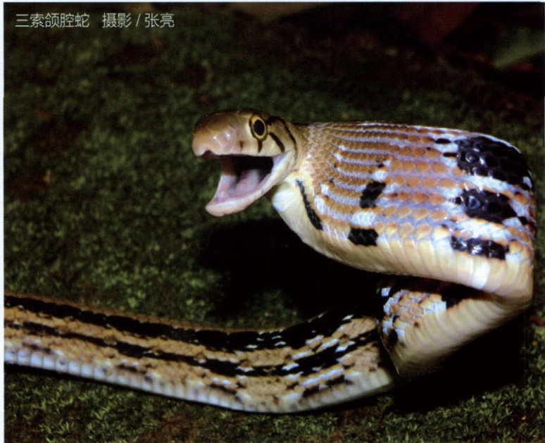
三索颌腔蛇