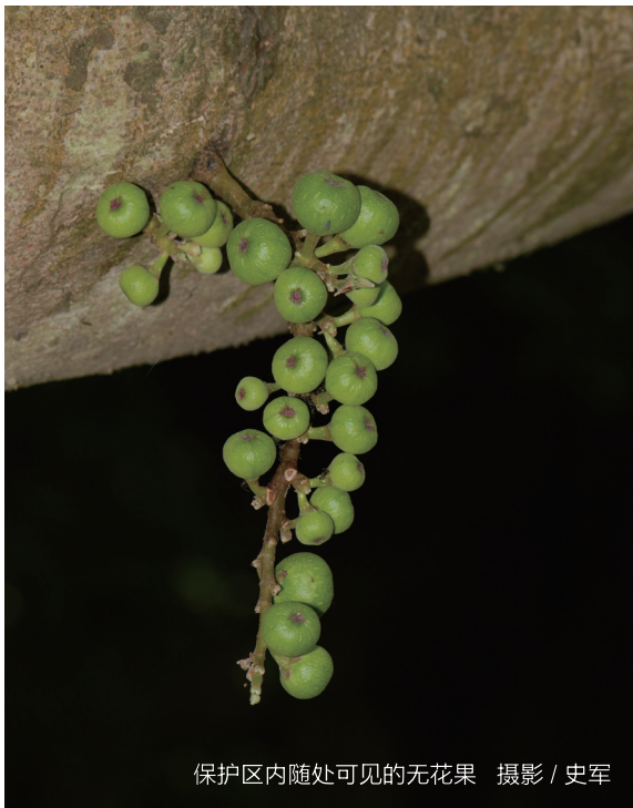
保护区内随处可见的无花果

民的生活。近些年来，经过政府和保护区的大力宣传，原来对白头叶猴造成威胁的偷猎、过度开垦土地和肆意砍伐森林的现象已有根本好转，村子里农民都非常支持白头叶猴的保护工作。除此之外，同学们还了解到一些当地农民的经济状况、文化教育、生活习俗等内容，感受到农民的生活水平确实有了很大的提高，家家户户都有洗衣机、冰箱、电视、手机、摩托车等。但是，当地的文化教育状况还有待改进，拥有四百人口的一个村子里面竟然总共只有五六个大学生。行路多者见识多，了解他人的生活状态，对比自己的，从而加深对生活的认识和感