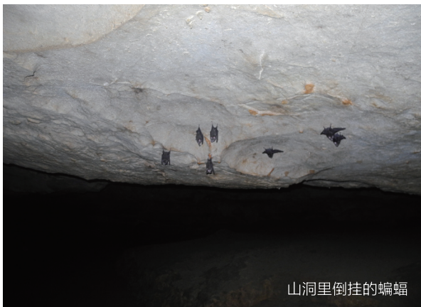
山洞里倒挂的蝙蝠