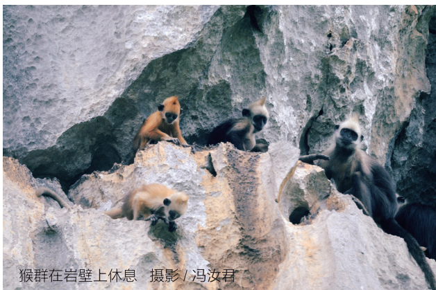
猴群在岩壁上休息