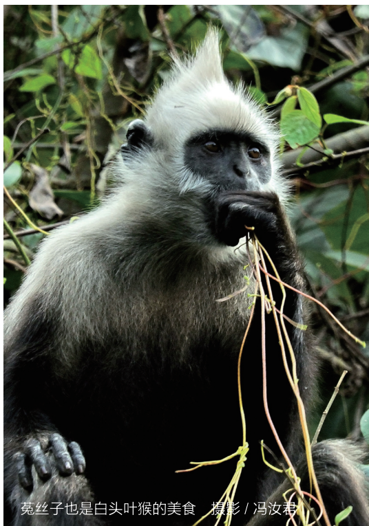
菟丝子也是白头叶猴的美食