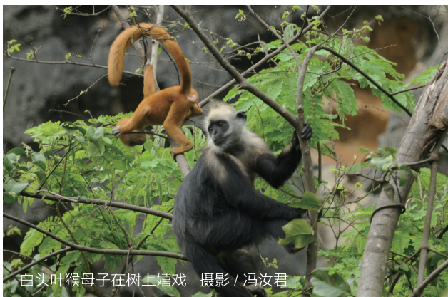
白头叶猴母子在树上嬉戏