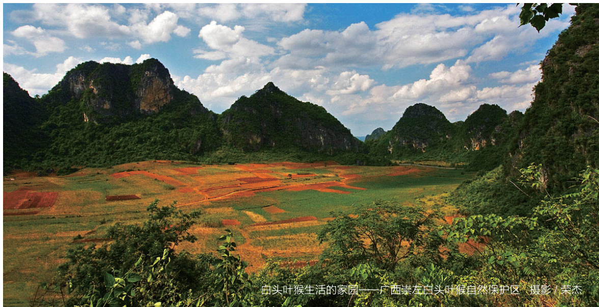
白头叶猴生活的家园——广西崇左白头叶猴自然保护区

白毛，颈部和肩部的毛也是白色的，身体其余部分的毛为黑色，所以得名“白头叶猴”。同学们满怀兴奋，徒步近一个小时，终于到达了观察白头叶猴的最佳位置——一面生长着郁郁葱葱的树木的岩壁附近。动物博物馆的张老师提醒同学们安静等待，白头叶猴比较胆小，警惕性很强，过于喧闹会把它们吓跑。同学们静下来，目光紧紧地盯着岩壁，都想快点发现白头叶猴的身影。突然，老师指着一处，轻声说道：“看！在那儿，那棵树的树梢在动！”大家循着老师手指的方向看去，果然，在一棵高高的树上，一只猴子蹲坐在树梢上，冲我们的方向看着，似乎也在打量着我们。因为在实地观察之前，保护区的研究人员已经给同学们做过报告，介绍了白头叶猴的基本习性，有同学立即判断出：“这是猴王，负责警戒放哨的！”又过了几分钟，大概是觉得我们这群人对它们没有威胁，猴王不再看我们，转过身去。这