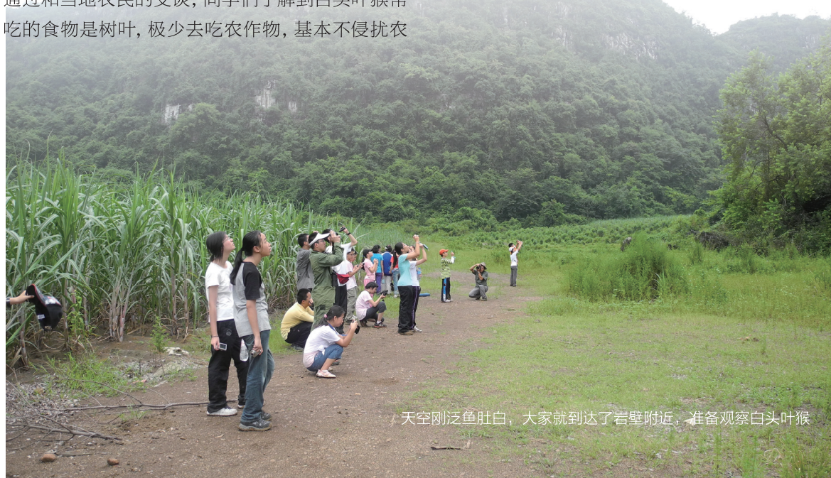
天空刚泛鱼肚白，大家就到达了岩壁附近，准备观察白头叶猴

为了更好地了解白头叶猴的生存现状，同学们又来到保护区附近的一个村子里进行走访调查。通过和当地农民的交谈，同学们了解到白头叶猴常吃的是树叶，极少去吃农作物，基本不侵犯农