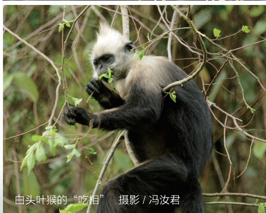
白头叶猴的“吃相”

时，岩壁上突然有好几棵树的树梢开始晃动，随着这晃动，同学们惊喜地发现了一只又一只的猴子，“这儿有一只！”“那儿也有！”感叹声此起彼伏。慢慢地，同学们不再出声，都静静地看着这群岩壁上的精灵，欣赏着它们在悬崖峭壁之上跳跃、在树枝藤条之间嬉戏的身姿。