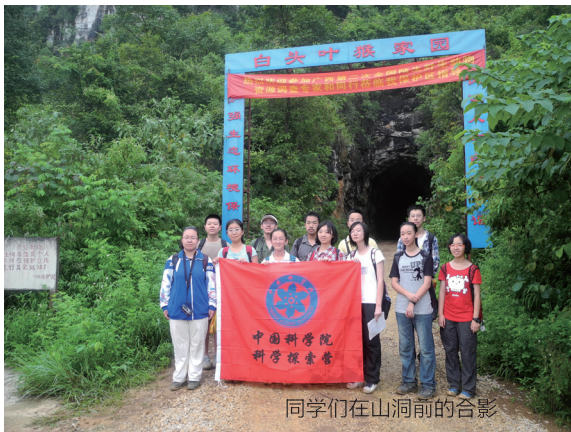
同学们在山洞前的合影

要说此次活动中最为特别、最令人难忘的项目，那肯定不能漏掉山洞露营。同学们有幸能在科学家做研究时住的山洞里住一晚上，做个“洞人”可是独特的体验喔。这个山洞离之前观察白头叶猴的石壁不远，傍晚或清晨还能听到猴子的叫声。虽然天气炎热，同学们汗流浹背，但一走进山洞，顿觉暑气全消，精神振奋。山洞很大很宽敞，同学们把背包在帐篷里放好以后，纷纷走出洞外观察周边环境。山洞前近处有一片小小的湖泊，水平如镜；远处石山连绵，树木葱郁。呼吸着新鲜的空气，真让人油然而生“世外桃源”之感。动物所的几位专家打