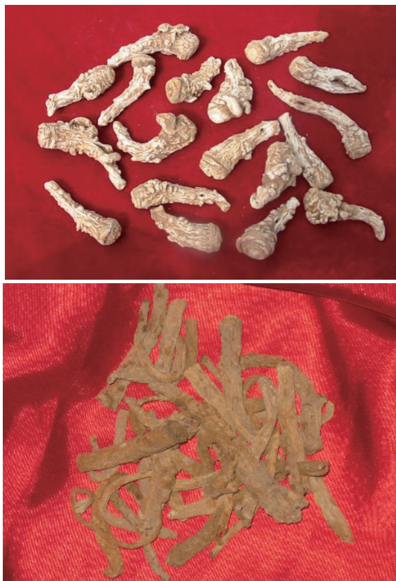
当归不同部位药效不同，当归头（上）补血，当归尾（下）活血。

在现代科学进入中国以来，中国的科学家们也逐渐习惯了西方式的理性思维模式。但是，中医及其思维模式目前尚不能被现代科学的思维模式所包容，试图用现代科学体系揭示传统中医内涵是不可能的。虽然，有一些研究结果很令人振奋，如把协调阴阳看作对生命物质系统（一个耗散结构）动态阈值平衡偏离的反馈调节，五行生克可能与代谢循环相关联，经络现象则是生物电化学振荡。但是，我们必须明确，目前这些观察结果可能是片面的、