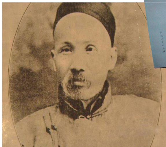
郑观应是汇通中西医学的积极倡导者。