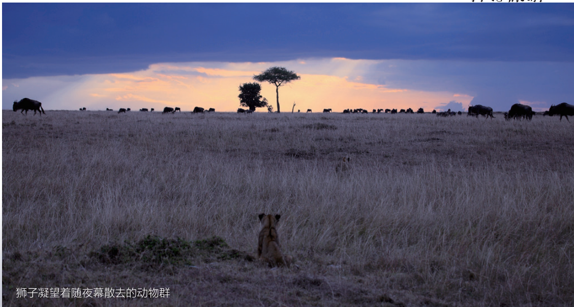
狮子凝望着随夜幕散去的动物群