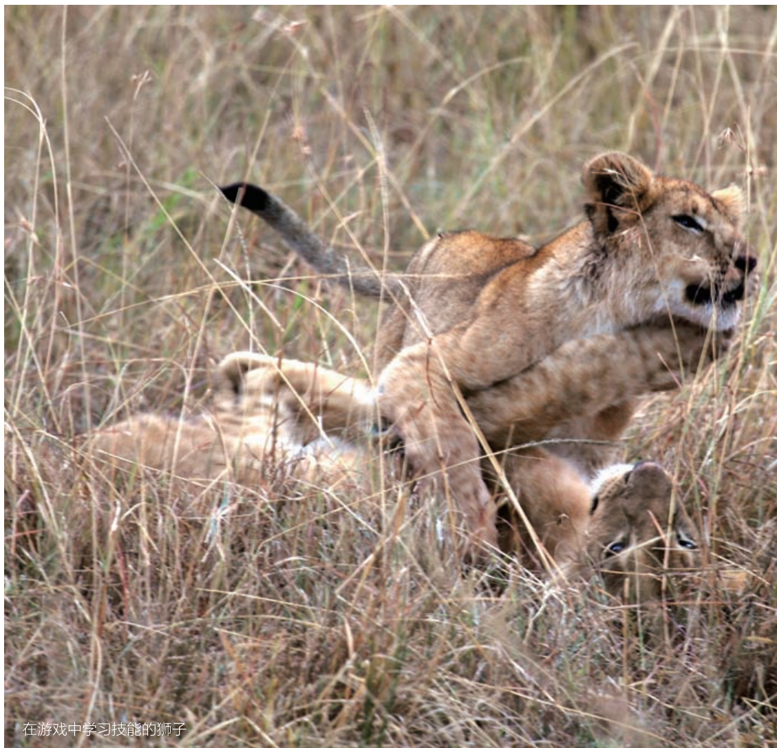
在游戏中学习技能的狮子

挡在最前面的几辆车立即挪开避让，毕竟野生动物不像马戏团或动物园的动物，它们身处自然，充满野性，性情变幻多端。好在正值大批动物迁徙过境之际，狮子每天能捕获的食物极为丰盛，对我们这些躲在