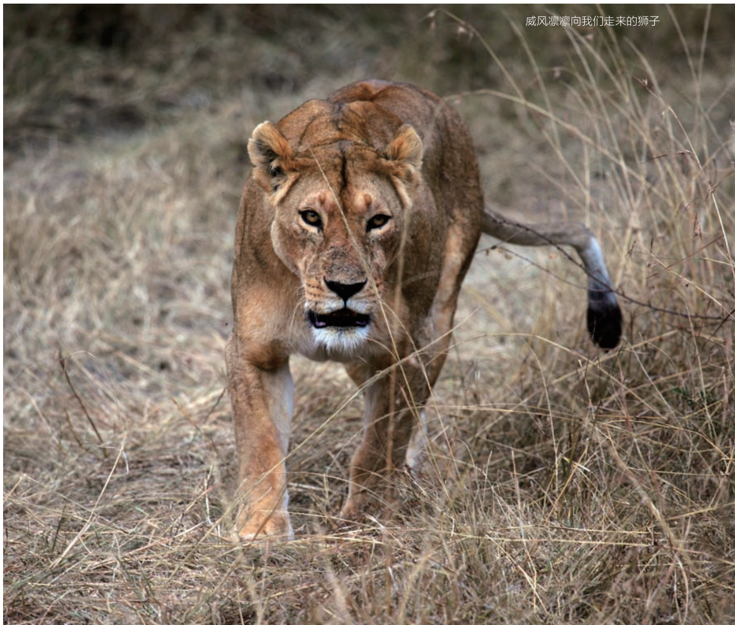
威风凛凛向我们走来的狮子