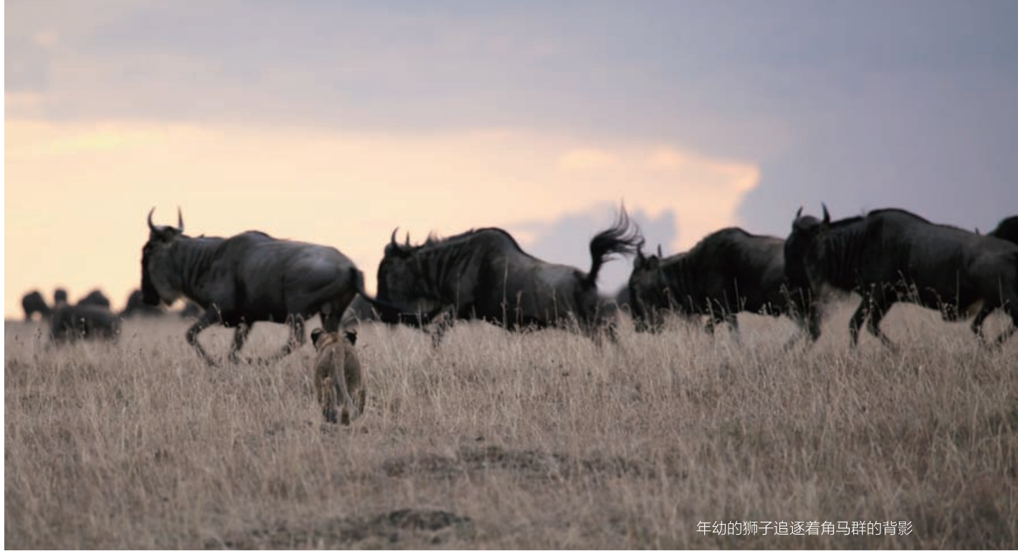
年幼的狮子追逐着角马群的背影