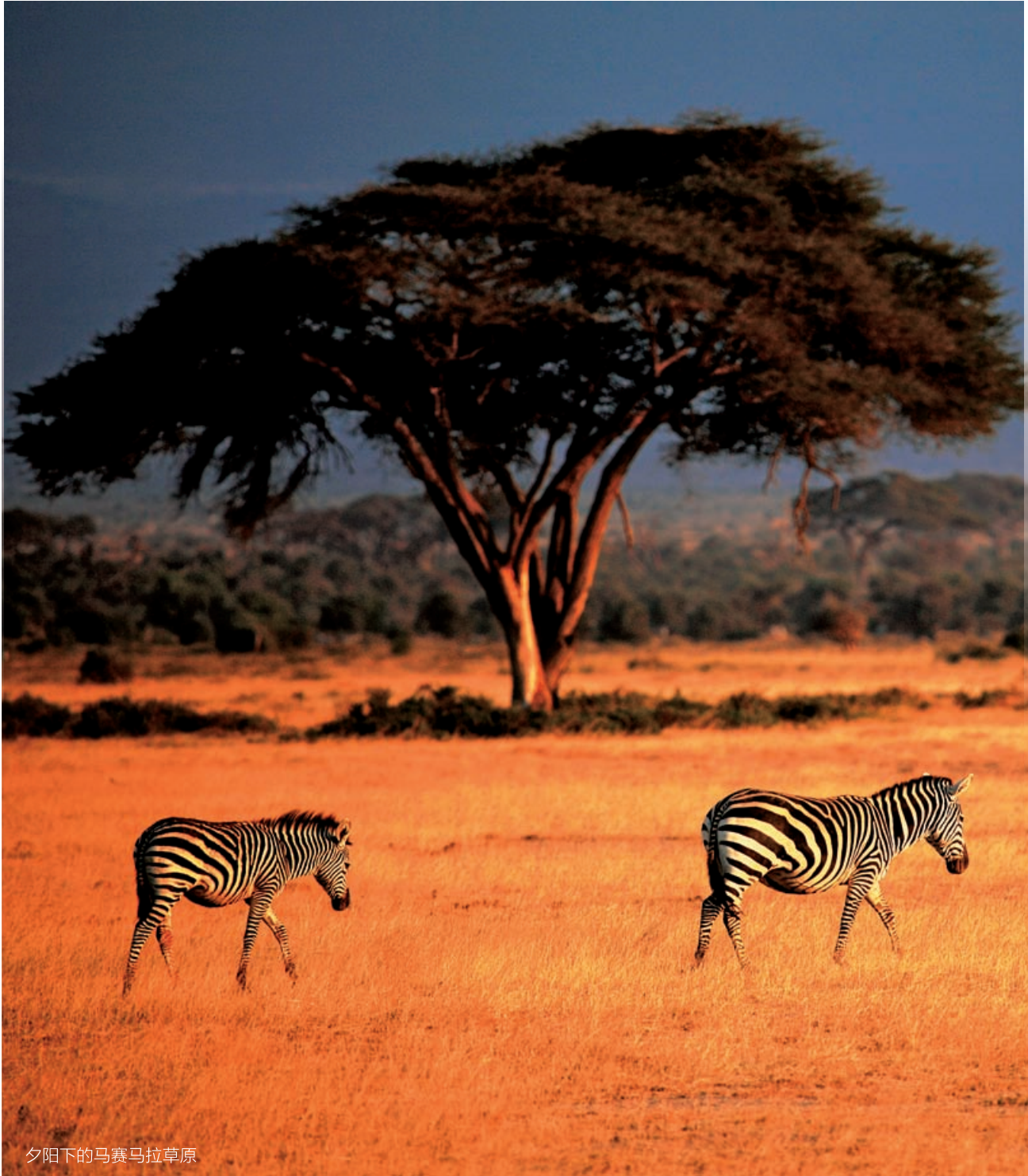
夕阳下的马赛马拉草原