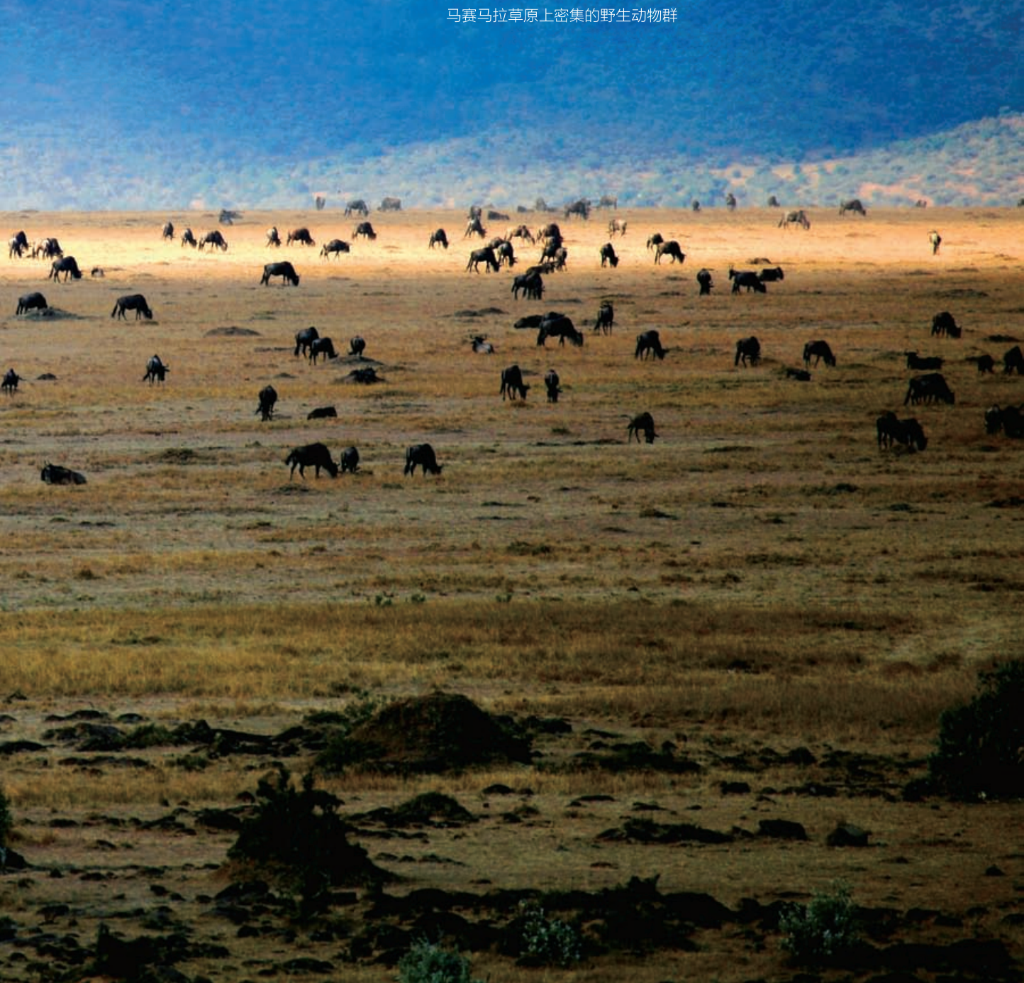
马赛马拉草原上密集的野生动物群

狮子王国, 狮子在这里处于野生动物以强凌弱、互相残杀食物链的最顶端, 是马赛马拉草原上没有天敌的“王者”!