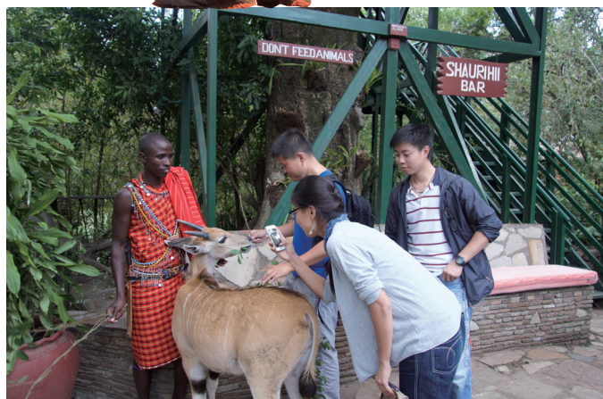
给大羚羊幼崽喂食