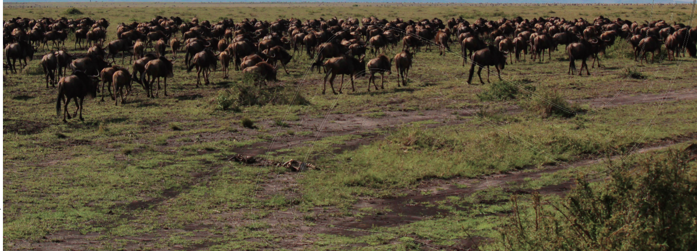
马赛马拉草原上的野生动物

在肯尼亚的纳瓦莎停留的晚间，我在微博上发表了对这次出游的感想：看到了很多鲜活的动物生活云云。很快有一个朋友评论我：说到底还是去瞎逛了。我一下子竟无言以对。