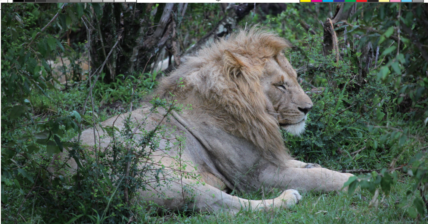
雄狮 摄影 / 吴海峰