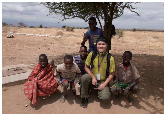
半只土豆和当地的小朋友

另一个让我佩服的，是执著的Steed。他执著地晚上拍星星，清晨拍日出，尽显天文达人的风范。最可歌颂的是，在别人（包括专家）都放弃的时候，Steed仍执著地等