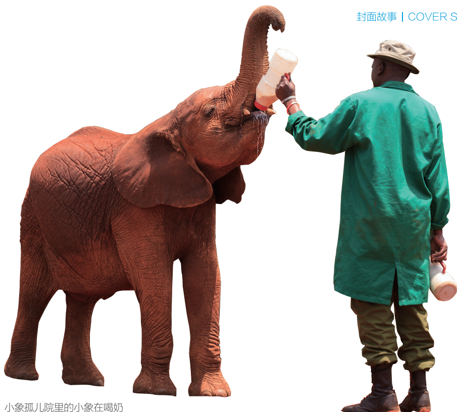
小象孤儿院里的小象在喝奶