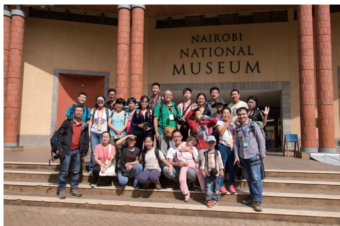
思问网肯尼亚科考活动的队友们