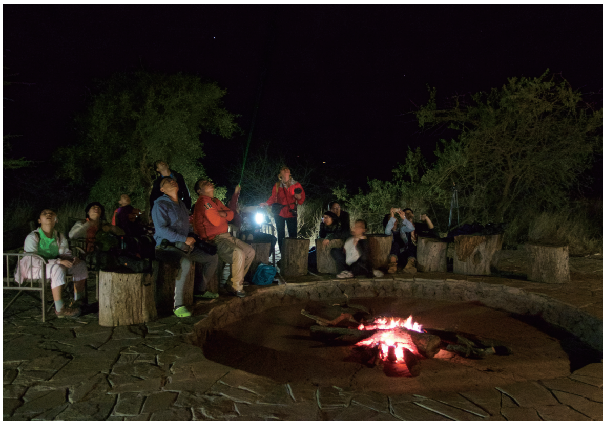
思问网天文专家Steed讲解南半球的星空

着饲料向长颈鹿索吻却被拒，狮子圈圈叉时张劲硕博士大喊“九秒钟！”，这些都是有证据的哦！让我感慨的是，这么多博士、教授，都没有谁端架子的，各种调侃以及自黑，妥妥的。