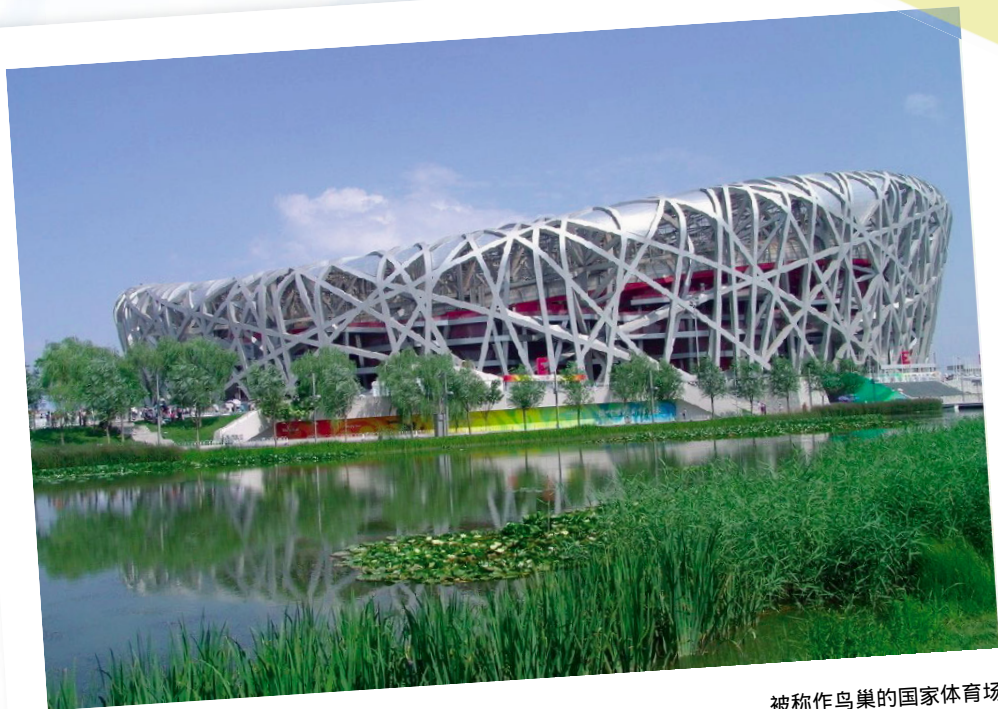
被称作鸟巢的国家体育场

师为了营造气氛，在南北两侧设置水下长廊，椭球形屋面主要采用钛金属板饰面，中部为渐开式玻璃幕墙。椭球壳体外环绕人工湖，湖面面积达3.55万平方米，各种通道和入口都设在水面下。由具有柔和色调和光泽的钛金属覆盖，前后两侧有两个类似三角形的玻璃幕墙切面，整个建筑漂浮于人造水面之上，行人需从一条80米长的水下通道进入演出大厅。大剧院造型新颖、前卫，构思独特，是传统与现代、浪漫与现实的结合。