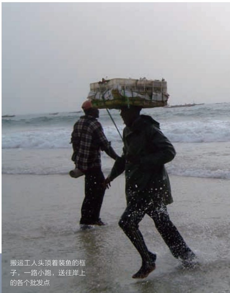
搬运工人头顶着装鱼的框子，一路小跑，送往岸上的各个批发点

我们通常一周买一次鱼，最常买的是石斑鱼。石斑鱼是暖水性近海底层名贵鱼类，有许多种，常见的有青石斑鱼和红石斑鱼。这种鱼身体椭圆形，头大嘴大，肉质肥美鲜嫩，营养丰富，清蒸红烧味道都不错，在国内被