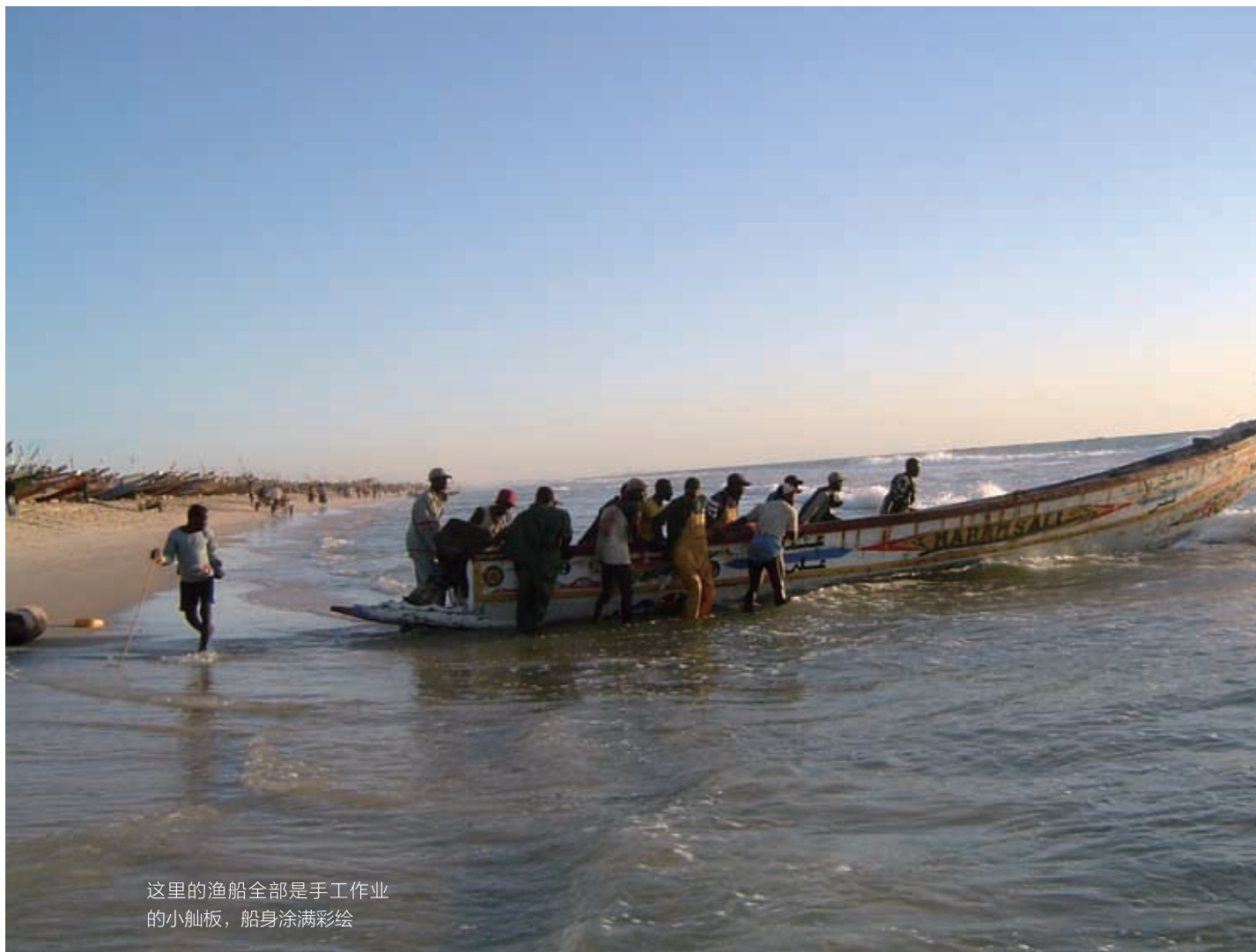
这里的渔船全部是手工作业的小舢板，船身涂满彩绘

感兴趣，而很客气地拒绝了制作精美、香味扑鼻的龙虾和石斑鱼，这倒是让大部分时间靠土豆洋葱过日子的我们，大饱了一回口福。