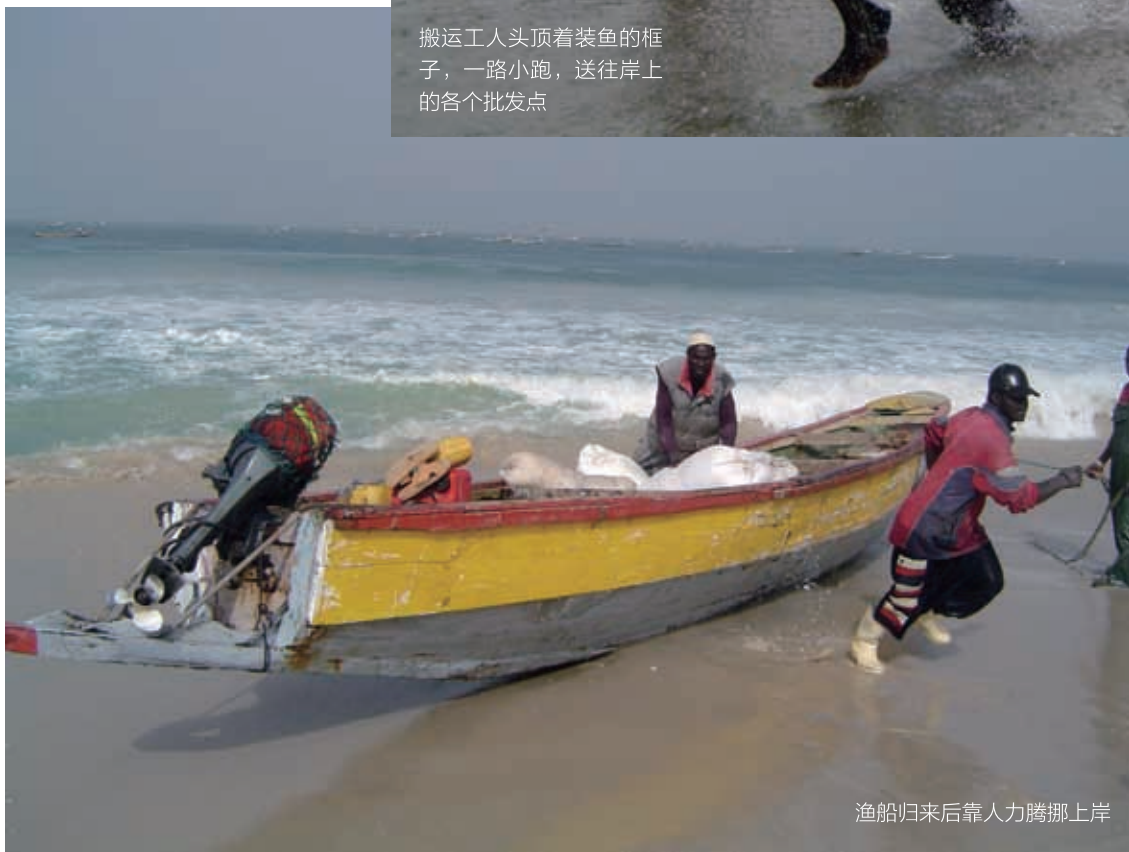
渔船归来后靠人力腾挪上岸