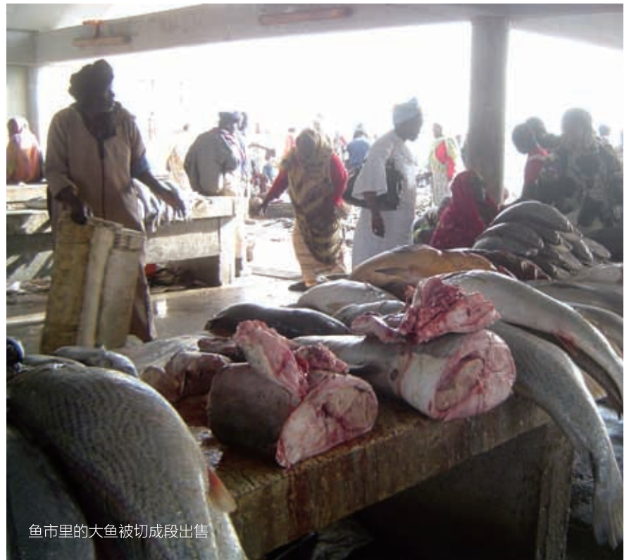
鱼市里的大鱼被切成段出售

毛塔有750公里的海岸线，地处世界著名三大渔场之一的西北非渔场，200米等深线的大陆架面积有34 000平方公里，专属经济区海域达23万平方公里。加那利寒流和赤道暖流在这里交汇，形成显著的涌升流，海底营