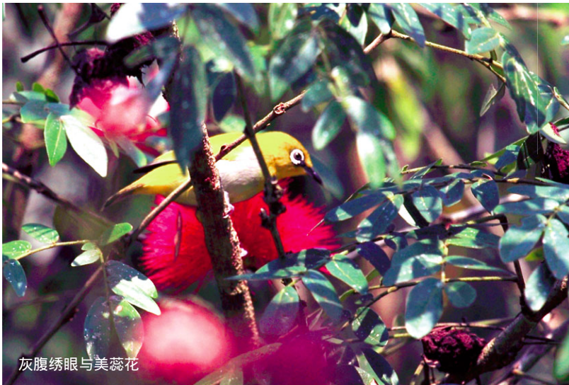
灰腹绣眼与美蕊花

下午3点左右，当我正在国树国花园一丛丛茂密的美蕊花前拍摄蜜蜂和蝴蝶时，突然感觉花叶婆娑、啾鸣鹊起，鸟情开始活跃了，原本宁静的花丛中开始出现一阵阵令人惊喜的骚动。