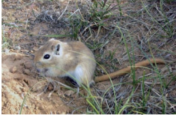
爪沙鼠隶属于啮齿目仓鼠科沙鼠属，分布于内蒙古自治区及其毗邻省区