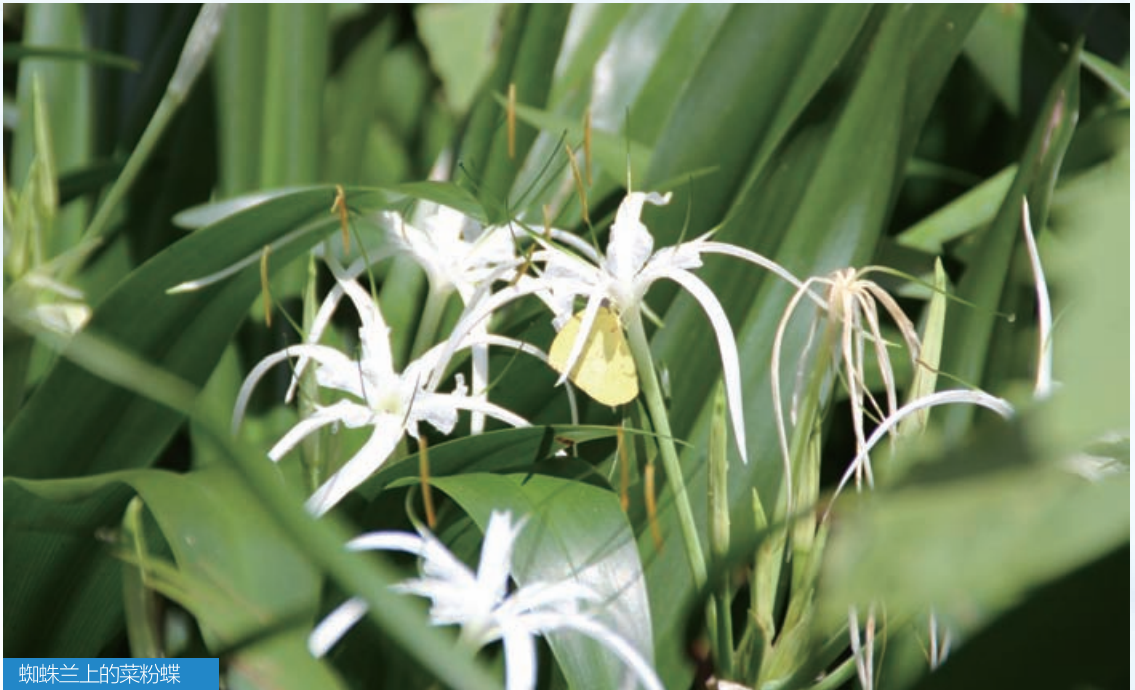
蜘蛛兰上的菜粉蝶