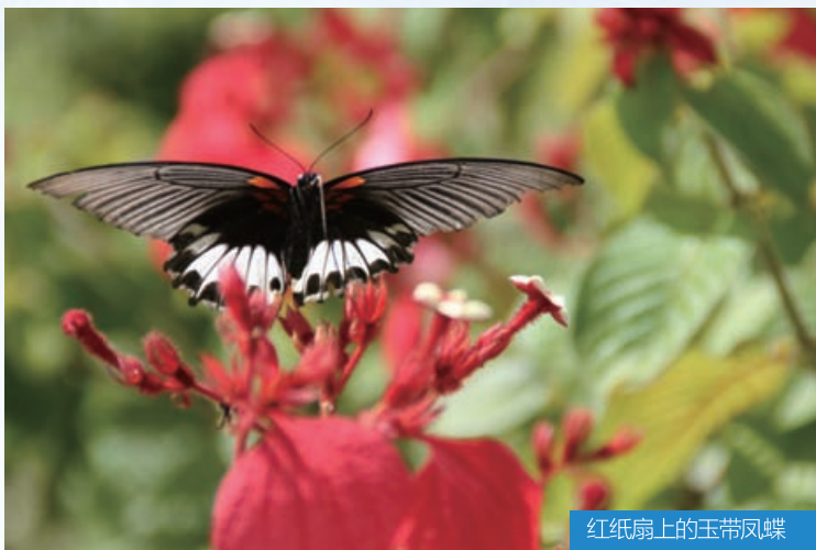
红纸扇上的玉带凤蝶