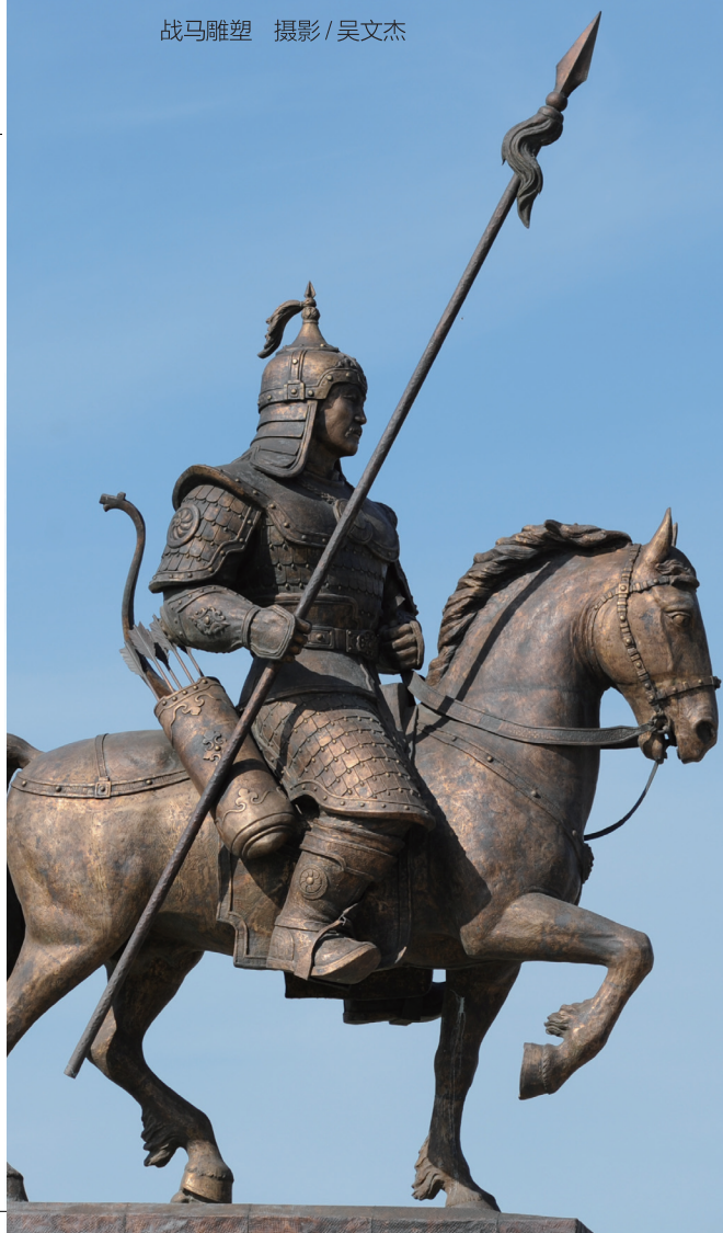
战马雕塑