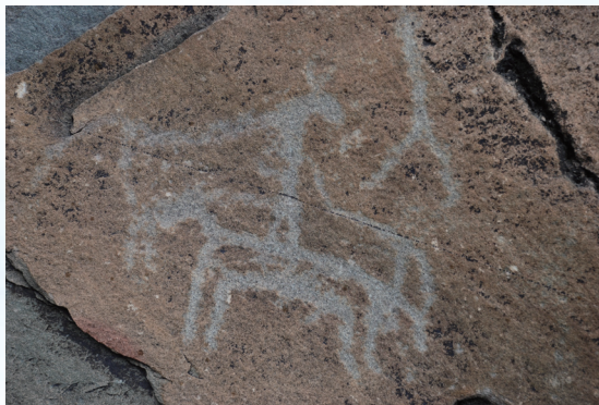
贺兰山岩画中的人马图

一提起马，每个人心目中浮现出的画面可能有所不同：有的是仰天长啸或轻快飞奔的骏马，有的是奋力拼杀的战马，也有的是忍辱负重的老马……对于马这种动物，中国最早的一部字典《说文解字》如此解释：“马，怒也，武也。”从中可见马儿本性之中的勇猛刚健，然而，一旦被套上轡头，它便成为了人类最温顺忠实的伙伴。