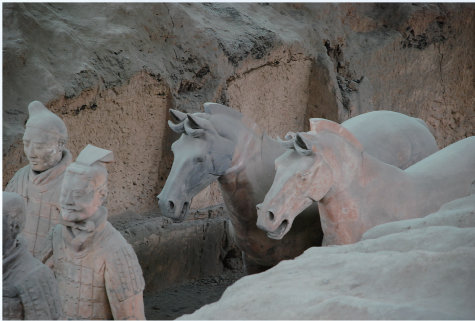
秦始皇兵马俑博物馆中的陈列

好手，只是在中国，马耕不像牛耕一样普遍。直到今天，还有地方保留着马耕田的生产方式。马的家族中，最荣耀的还要数战马。招兵买马、千军万马、秣兵厉马、金戈铁马……从这些成语可见马与战争的关系有多么密切。中国历史上曾用马拉战车的数量来形容国力强盛，以“万乘之国”为一等军事强国，“千乘之国”为二等军事强国。不少帝王和将军借助得力的战马成就了伟业，这些马儿的美名也随着主人流传下来，比如秦始皇的“追风、白兔、追电”，唐太宗的“昭陵六骏”，刘备的“的卢”，项羽的“赤兔”……《后汉书》：“吕布常御良马，号曰赤兔，能驰城飞堞。”“人中吕布，马中赤兔”，赤兔马一直是好马的代表。成吉思汗更是率领“马背上的民族”建立了中国历史上最为强大的军事帝国。马儿值得赞美的太多太多，也怪不得古人在它身上依附了雄奇瑰丽的想象。