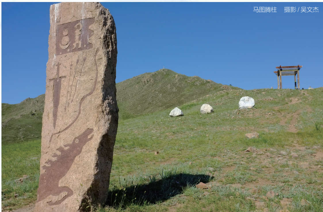
马图腾柱