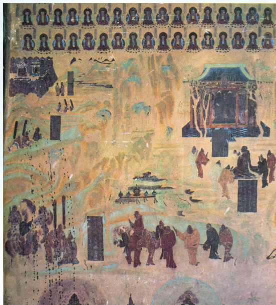
张骞出使西域，带回了有关汗血宝马的信息