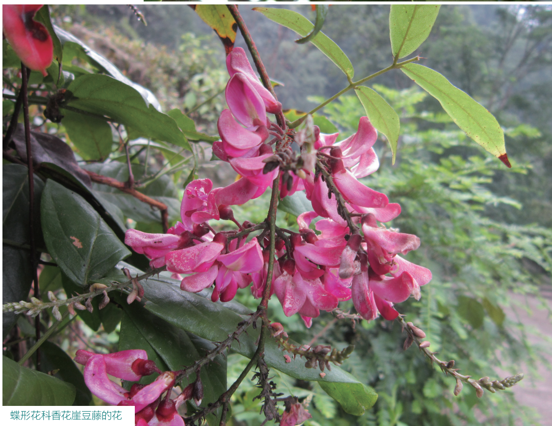
蝶形花科香崖豆藤的花