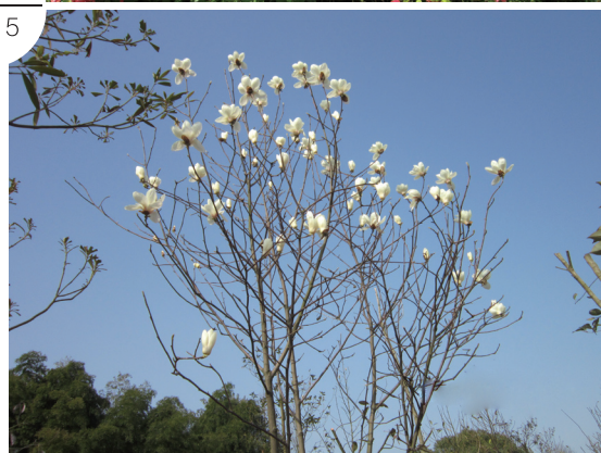
4. 官山红杜鹃 5. 白玉兰——江西省省级重点保护植物

仅观赏价值高，而且有的还兼具药用功效、保健作用。鹅掌楸是国家二级重点保护野生植物，常用行道树和园林绿化树种，它那宽大的如马褂的叶子至今飘动在许多城市的街道、庭院、公园等地。扶芳藤是一种集观赏、药用、保健食用等多种功能于一体的常绿蔓生灌木。