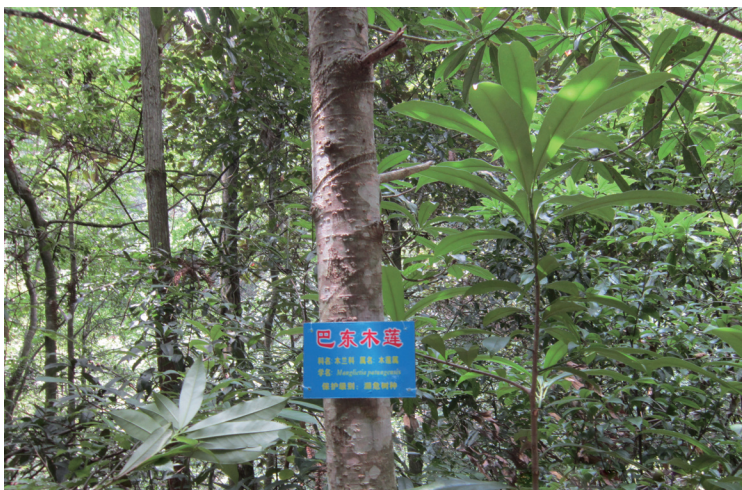
所有的“身份证”一般是天蓝色或绿色背景上印黄色或红色的字，与自然环境很协调

所有的“身份证”一般是天蓝色或绿色背景上印黄色或红色的字，与自然环境很协调。有一次，一位细心的南昌游客数了他所看到的全部树牌，发现有403个牌，珍贵植物种类多达178种，其中国家级重点保护的有6种，江西省级重点保护的有27种，并有野生珍贵植物扎堆出现的现象，往往看到一棵珍稀植物时，在其周边不远处能看到几棵甚至几十棵不同种类的珍稀植物。比如：在东河保护管理站驻地，房前屋后不到1200平方