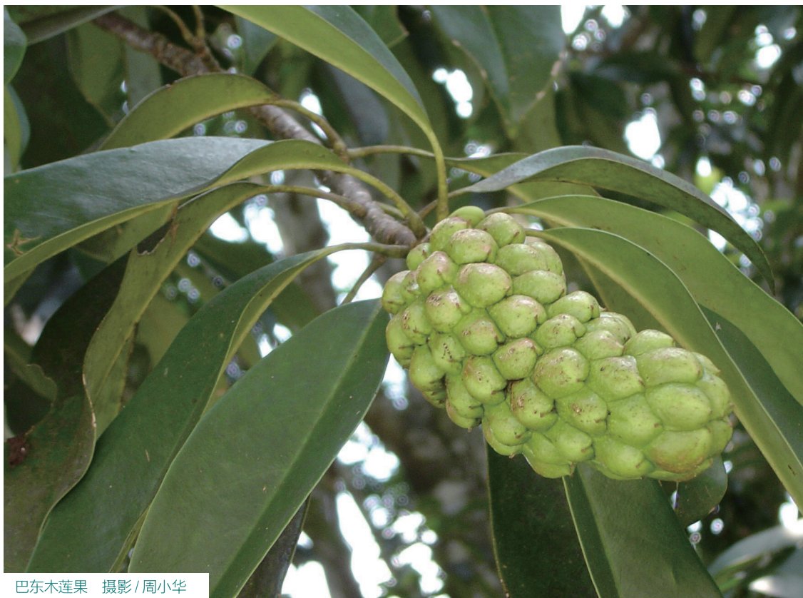
巴东木莲果