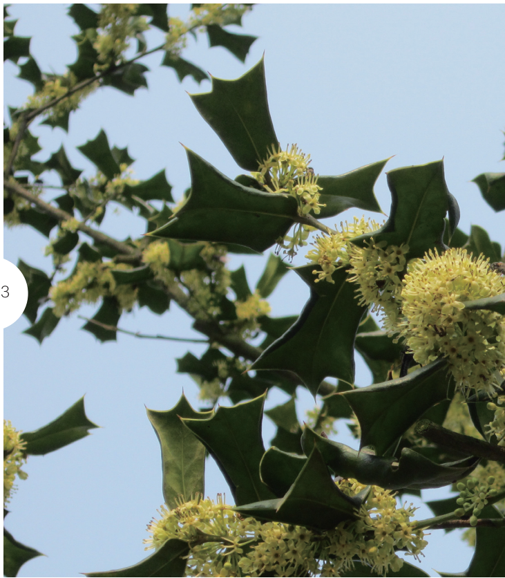
1. 中华猕猴桃花 摄影/刘以珍 2. 云锦杜鹃花 摄影/李存海 3. 枸骨冬青——江西省省级重点保护植物

低矮，高3.5米左右，树种组成单一，85%的树为云锦杜鹃，外围混生有满山红、杜鹃、水马桑、虎皮楠、香冬青等树种。该群落周围尽是乱石堆，因而该林子如盖在乱石中一床巨大的绿色被子，又如一块硕大的绿玉静静地镶在谷地上。云锦杜鹃为属于杜鹃花科的一种美丽的常绿植物，是江西省重点保护野生植物，它的花大而美，有白色，粉红，白中透水红等。每年的4月至5月上旬，是其盛开的时期，爱花的君子们可要记得这个时间。