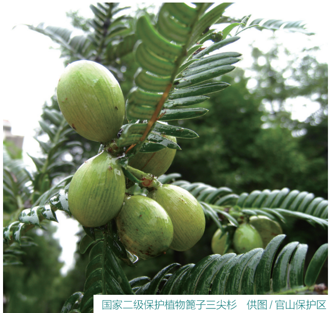
国家二级保护植物篦子三尖杉