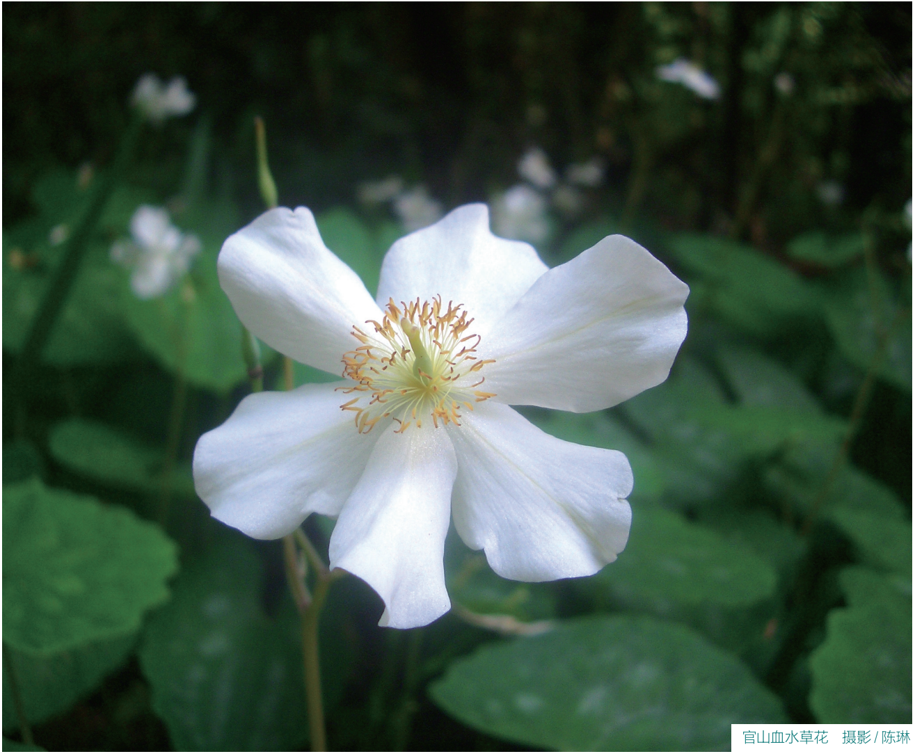
官山血水草花