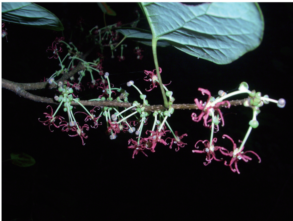
长柄双花木

场—石花尖—麻姑尖—龙坑，龙门大窝坑，西河保护管理站驻地—大西坑等，可以欣赏到大量珍贵植物。