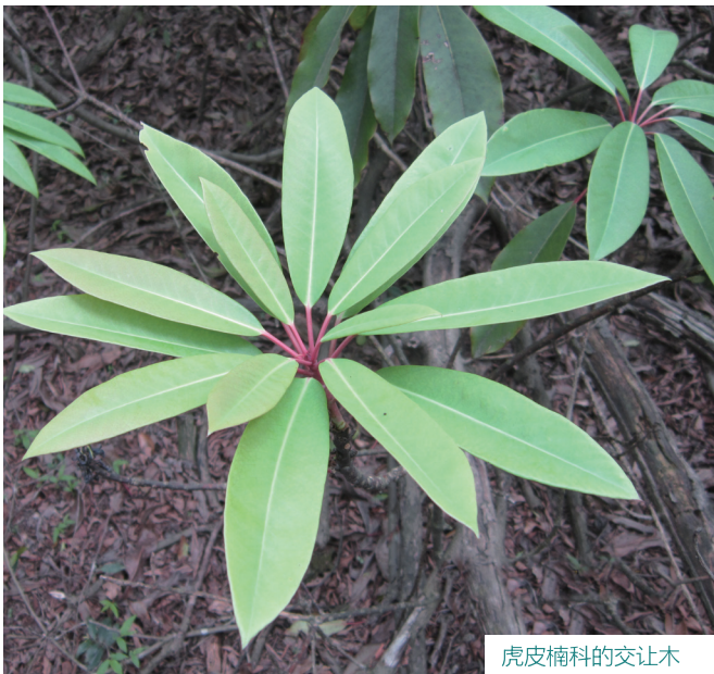
虎皮楠科的交让木