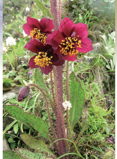
多刺绿绒蒿