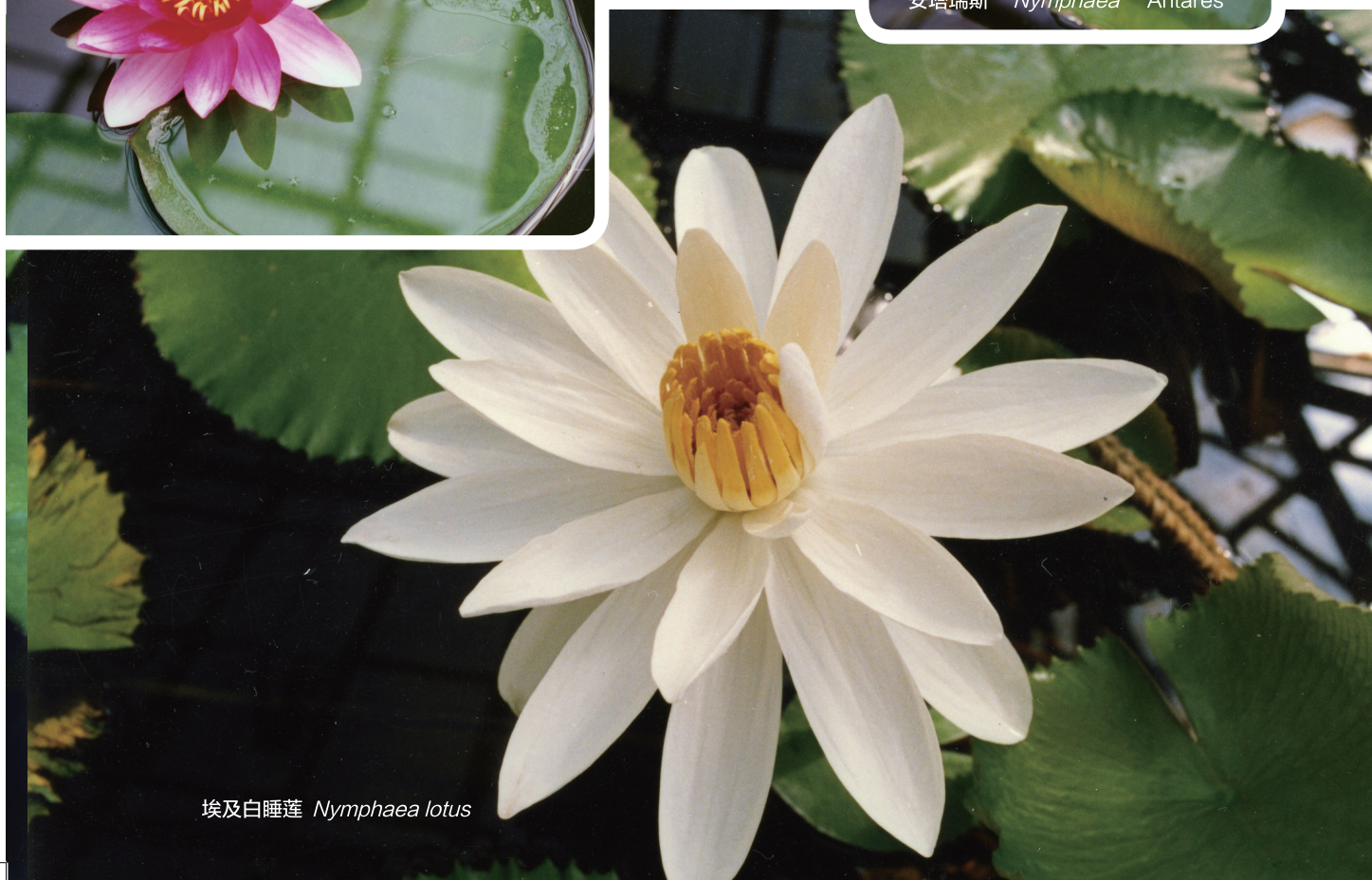
埃及白睡莲 Nymphaea lotus