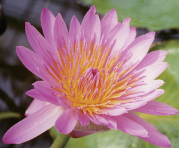
‘安塔瑞斯’ Nymphaea ‘Antares’