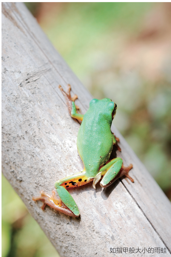
如指甲般大小的雨蛙