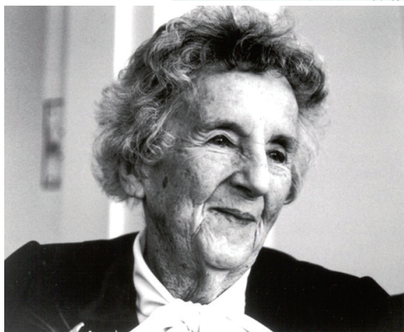
韩德森是美国著名的护理理论家、教育家，她被称为是“20世纪的南丁格尔”。