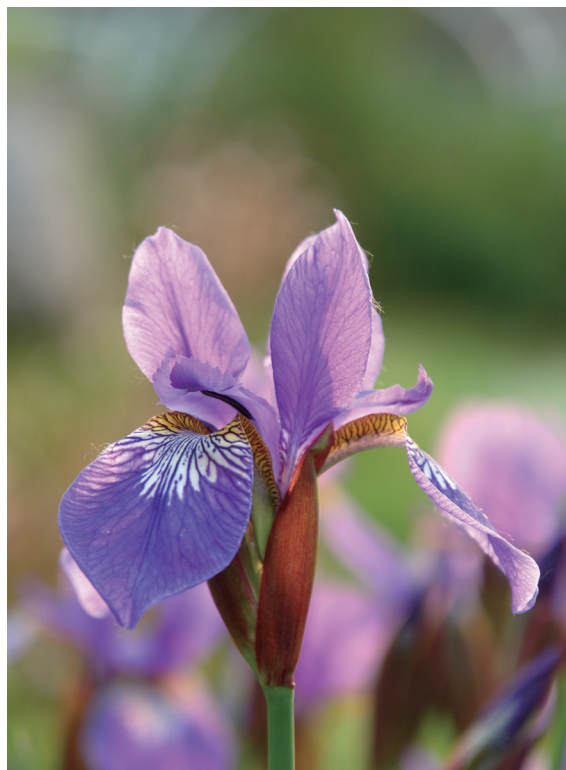
▲ 鸢尾（2010年拍于北京植物园）。初夏到了下午5点多的时候，光线虽不如正午时候那么强，对着植物拍照还是光线过强，这个时候逆着光线拍的花卉，就非常柔和，而且还会透出一缕太阳光的金色