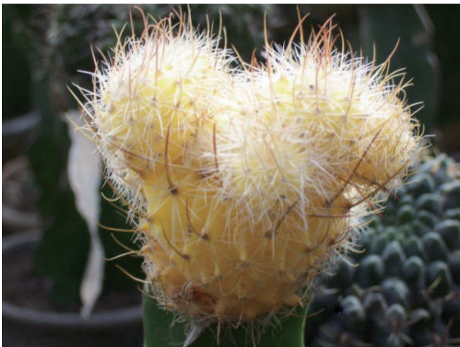
▲ 仙人掌（2006年拍于北京植物园温室）。仙人掌浑身都是刺，和五颜六色的花卉相比，基本上都会受到很多拍摄者的冷落，但是把握好角度，透过光线拍过去，这种带刺的家伙也很可爱