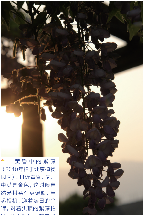
▲ 黄昏中的紫藤 (2010年拍于北京植物园内)。日近黄昏, 夕阳中满是金色, 这时候自然光其实有点偏暗, 拿起相机, 迎着落日的余晖, 对着头顶的紫藤拍过, 让人对这一整天都充满微微的留恋