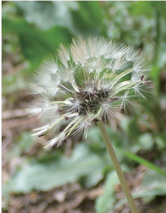
▲ 蒲公英 (2006年拍于北京植物园)。正午时分在北京植物园实验楼后面的草地上, 光线很强的时候逆光拍去, 像是草丛中闪闪发光的水晶。只有拍过才知道, 蒲公英其实也很美