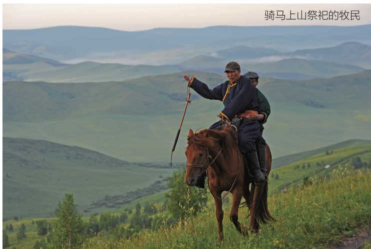
骑马上山祭祀的牧民

山上祭山的同时，山下已有喇嘛开始敲鼓鸣锣诵经，大多数蒙古女人静静坐在一起诵经，一起祈祷。她们可以手捧牛排、羊