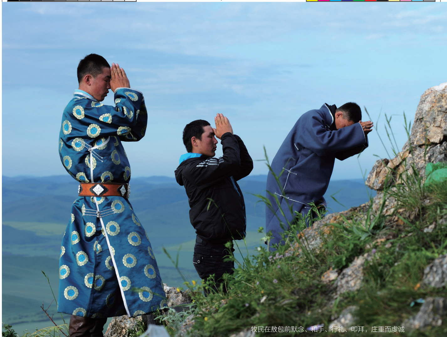
牧民在敖包前默念、和手、行礼、叩拜，庄重而虔诚