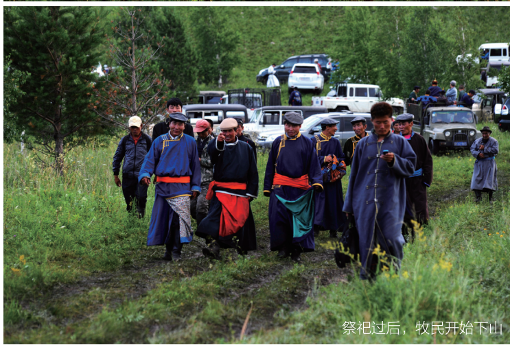
祭祀过后，牧民开始下山

在我们这个白天看蓝天，晚上看星星都成为奢望的今天，能保存下这样一片大草原，草还绿着，天还蓝着，云还白着，水还清着，真要感谢这里世代代爱护自己家园的巴尔虎蒙古人