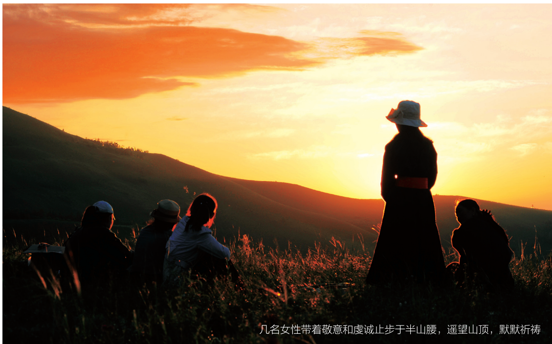
几名女性带着敬意和虔诚止步于半山腰，遥望山顶，默默祈祷

天未亮，东方鱼肚白，山路上却已是车灯的长龙，也有骑马和步行上山的人，浩浩荡荡，一起登山。