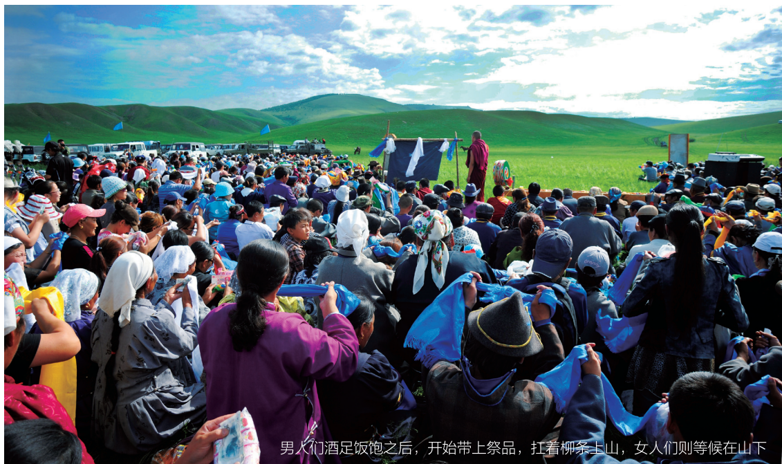
男人们酒足饭饱之后，开始带上祭品，扛着柳条上山，女人们则等候在山下

到毛盖图敖包祭大山，往往要全家人出动，全村人一起同往，开着车，赶着勒勒车，骑着摩托车，骑着马，拉上牛羊、酒菜以及各种祭祀用品提前一天或几天来到山脚下，在这里扎下蒙古包，安下炉灶，宰牛杀羊，煮肉喝酒。当然，煮肉是女人的活，男人们则在品茶喝酒，谈天说地。青年人聚在一起，唱歌跳舞。小孩子们在大人中间穿梭，玩得不亦乐乎。