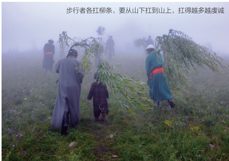
步行者各扛柳条，要从山下扛到山上，扛得越多越虔诚

步行者各扛柳条，要从山下扛到山上，扛得越多越虔诚。这些柳条也要系上哈达，插到山顶的敖包上。据说，柳树代表生命