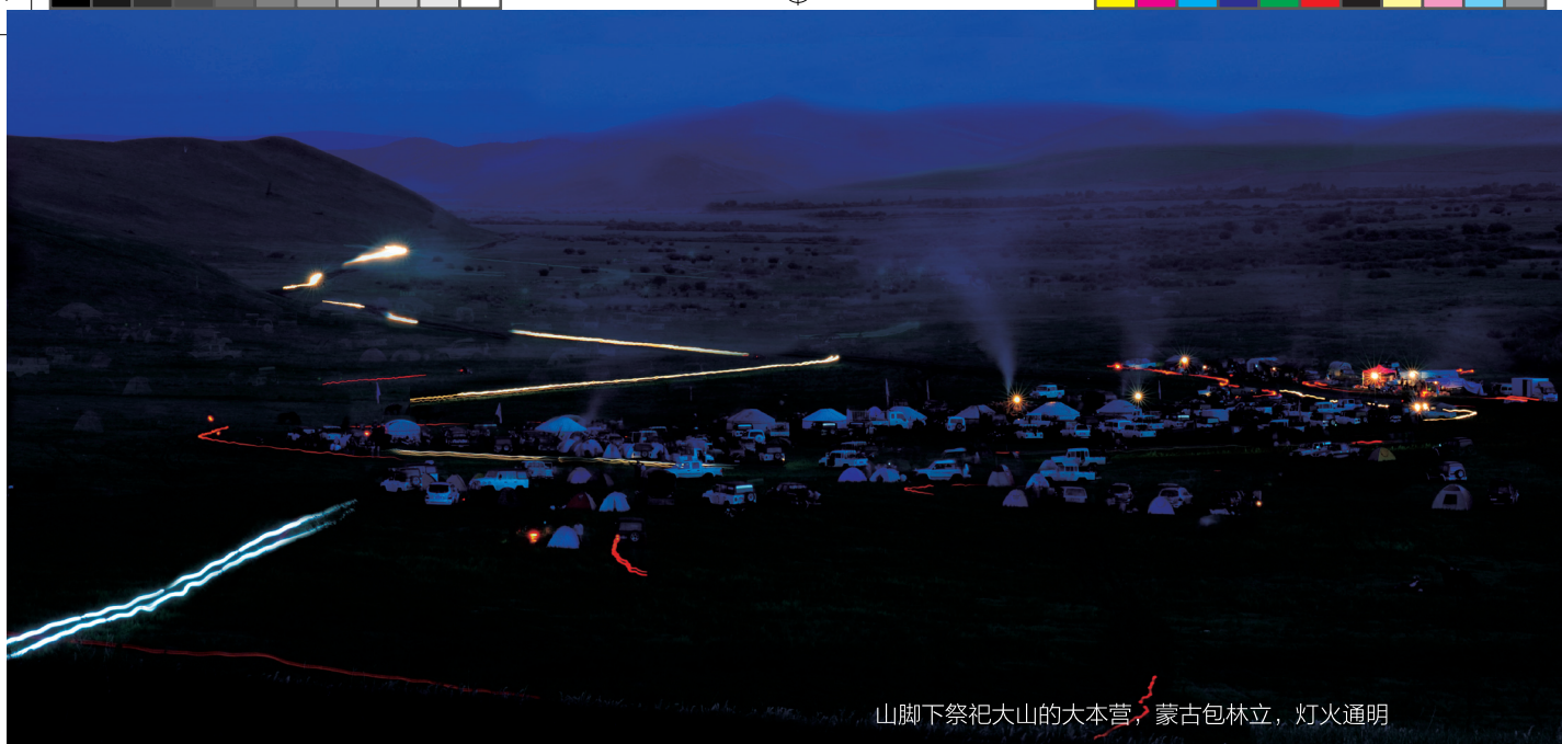
山脚下祭祀大山的大本营，蒙古包林立，灯火通明

的崇拜，增加更多的对大自然的敬畏。这也许就是毛盖图敖包会吸引更多人来膜拜的秘密吧。