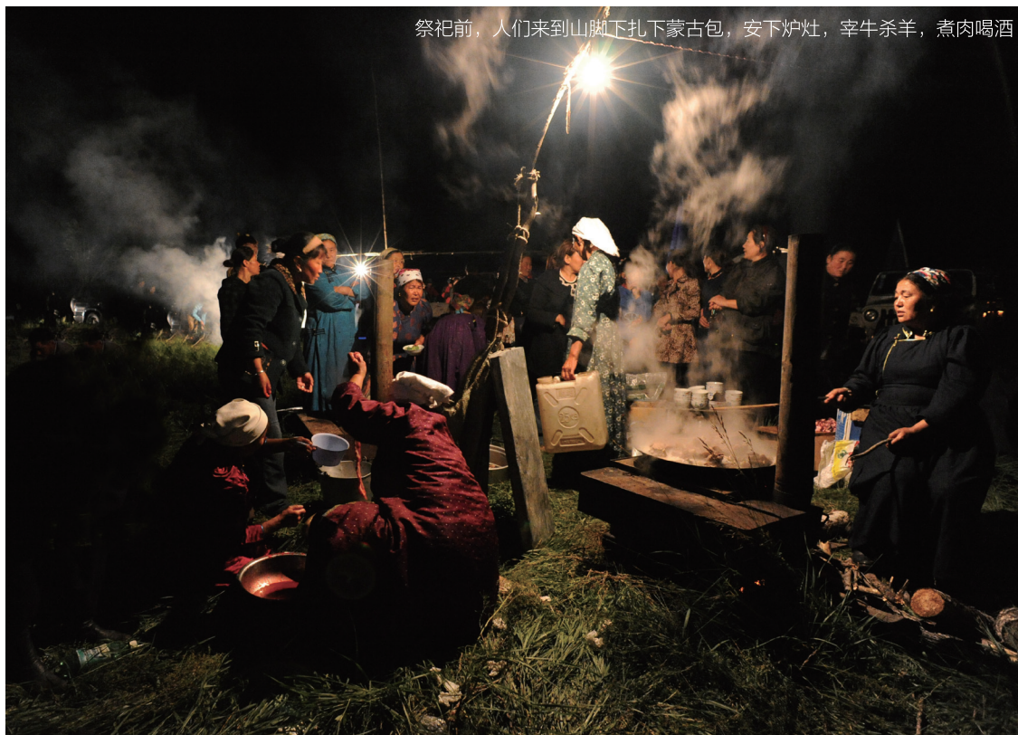
祭祀前，人们来到山脚下扎下蒙古包，安下炉灶，宰牛杀羊，煮肉喝酒