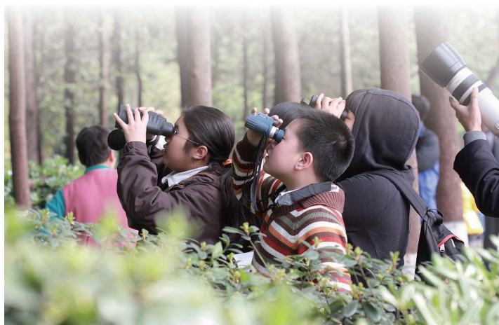
◆ 四川2010年“爱鸟周”活动举办的观鸟大赛中，中小学生在认真观鸟。

举办各种爱鸟护鸟宣传活动，如组织观鸟比赛，开展征文以及摄影、书法、绘画展览，科普宣传讲座，专家在线访谈……促使全国“爱鸟周”成为广大人民群众接触自然、参与保护、关注生态、享受文化、增长知识的活动。