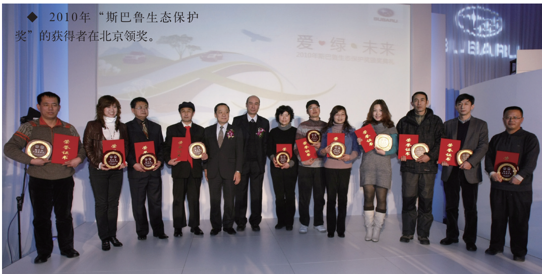
◆ 2010年“斯巴鲁生态保护奖”的获得者在北京领奖。