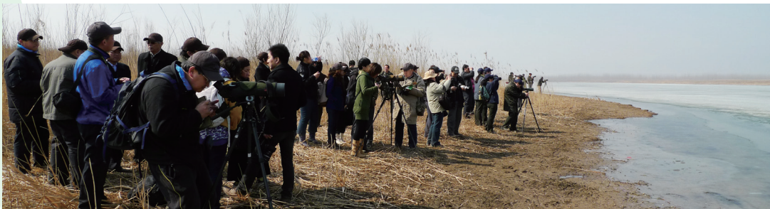
◆ 北京2010年“爱鸟周”活动中，市民在野鸭湖观鸟。