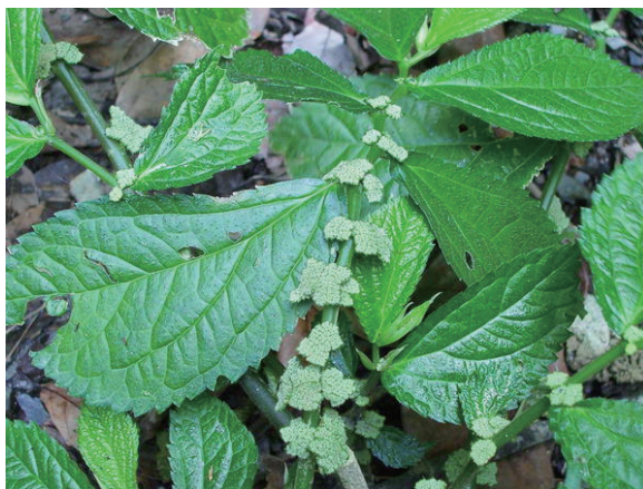
楼梯草属的 各种花序

在实地调查之前，翻阅资料得知楼梯草属的很多种类都被用作传统药用植物，历代本草里都有记载。根据资料记载，荨麻科楼梯草属里的庐山楼梯草，即接骨草（水边麻），始载于《浙江天目山药物志》，又名赤车使者、白龙骨、痒痒草，有“活血祛瘀，消肿解毒，止咳”的功能。条叶楼梯草全草用于骨折损伤的