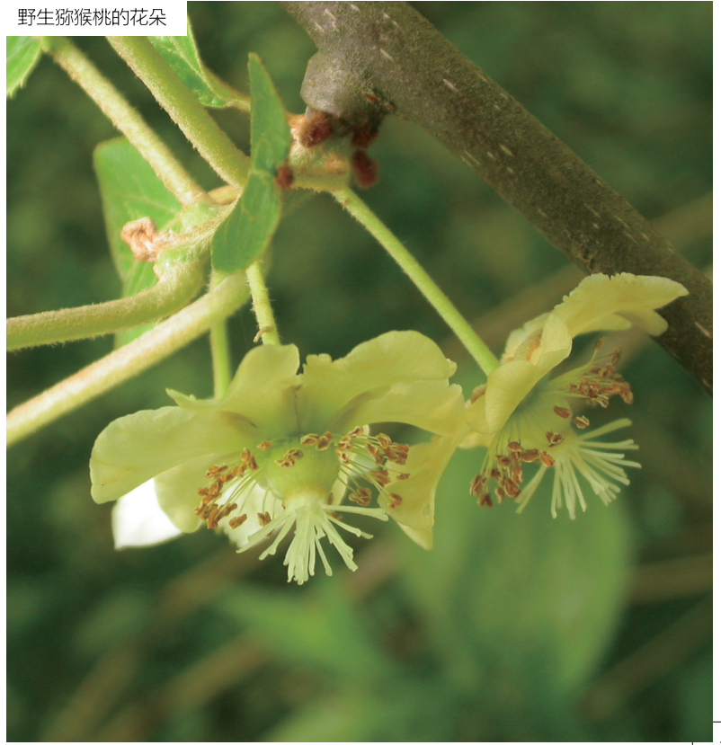
野生猕猴桃的花朵