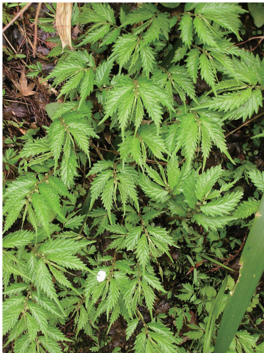
楼梯草属植物多分布于中等海拔的山谷林下、山坡草地、灌丛、沟边、石灰岩山地林下地被阴湿处，在广西贵州一代比较湿的石灰岩土壤或石灰岩生境上也比较常见