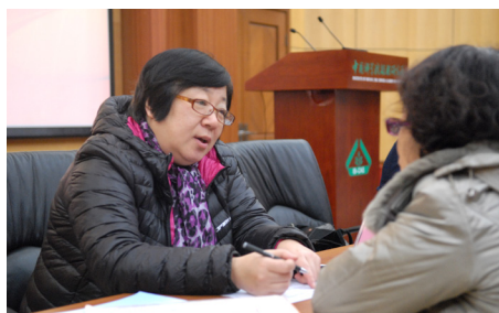
北大医院的医生在提供义诊咨询