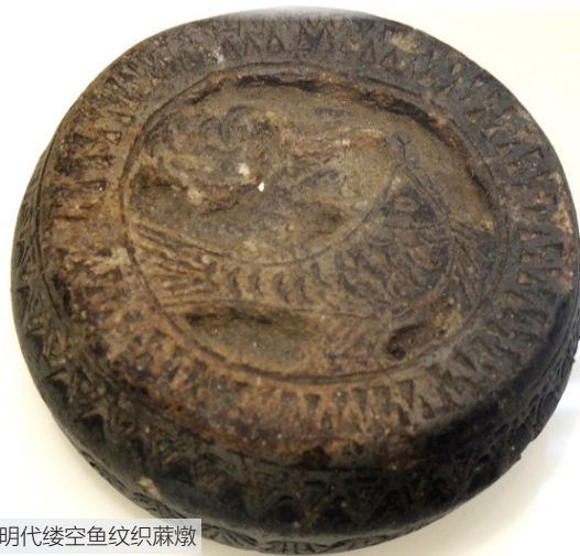
明代镂空鱼纹织蓆墩