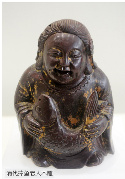
清代捧鱼老人木雕