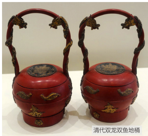
清代双龙双鱼地桶