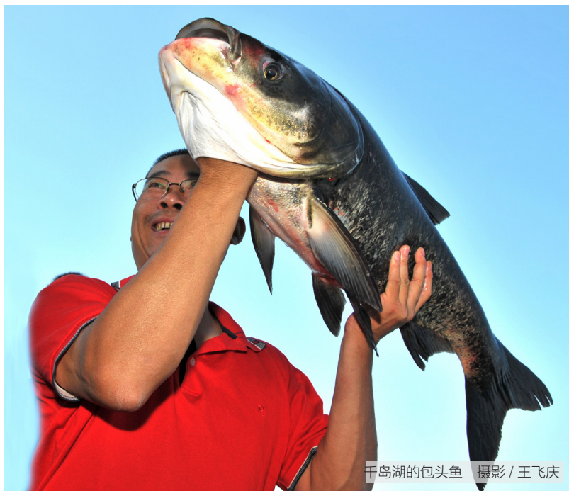
千岛湖的包头鱼

鱼类养殖是保护鱼类资源的主要方式之一。原始鱼类养殖业诞生于奴隶社会，自殷商末期始就有池塘养鱼，到战国时已较发达。公元前46年前后，越国大夫范蠡所写的《陶朱公养鱼经》便是对当时民间养鲤经验的总结性文献。