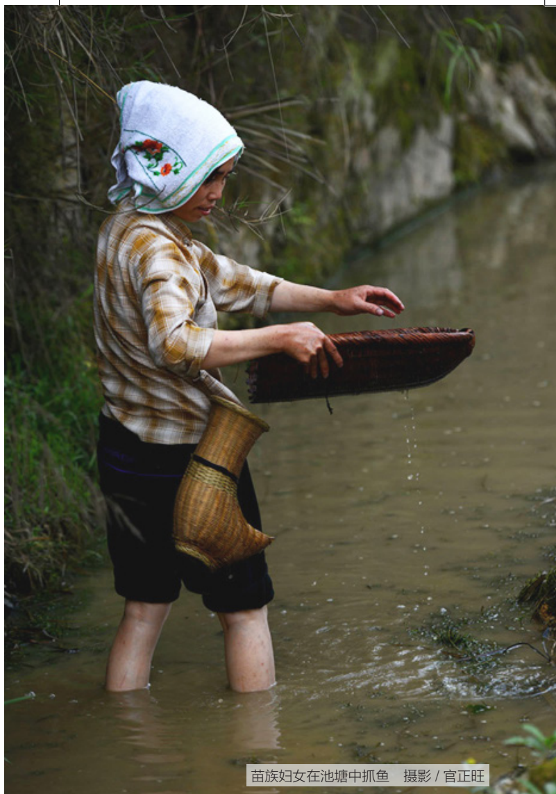
苗族妇女在池塘中抓鱼

书》的《武帝本纪》中，颜师古注释“昆明池在长安西南，周围四十里”，可谓养鱼的面积已经很大了。