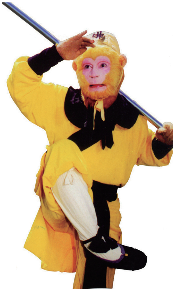
电视剧《西游记》中齐天大圣的形象

看过《西游记》的人都知道，“齐天大圣”不过是孙悟空自封的名号，玉皇大帝封给他的真正官位是“弼马温”，让他在天官御马监养马。不过马与猴的关系也确实密切。相传旧时马厩上总要系上一只猴子，作用是避邪、去除瘟疫、守护马匹安全。而过去，中国西南高原上的商人，在驱赶马帮长途贩运时，也常带一只猴子同行。据说，猴对骡马的疾病很敏感，常能帮人发现病马，以防止瘟疫扩散，所以商人们住店前总是先让猴子嗅一遍，无疫情才安置马匹。有句话说“艺术源于生活”，想必吴承恩所撰写的孙悟空官封“弼马温”的情节，也是以当时人们相信猴能避马瘟的习俗为基础的。今天，在陕西、甘肃、山西一带，特别是陕西