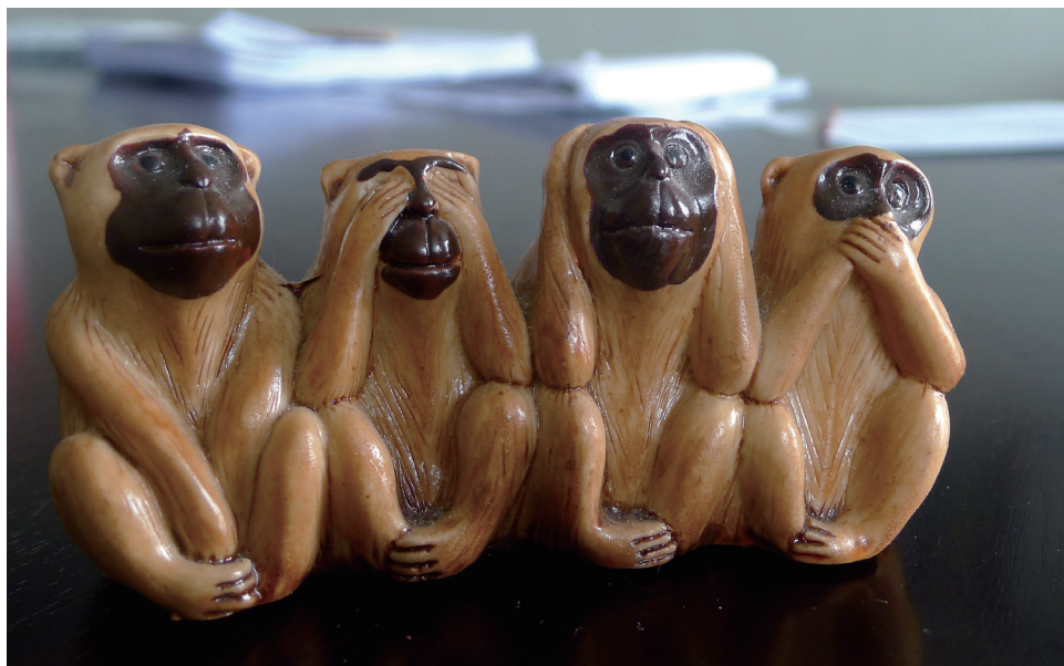
4只猴子表现《论语》典故：非礼勿视，非礼勿听，非礼勿言，非礼勿动

汉族地区的猴图腾崇拜虽不像少数民族那样一般都证据确凿，但是也留有一些遗迹。在四川成都流传一则神话，说人类始祖伏羲和女娲最初也是猴子，与其他猴的不同点是他们身上没长毛，会用树叶遮羞，会站起来走路，双手还会比比划划地交流，于是