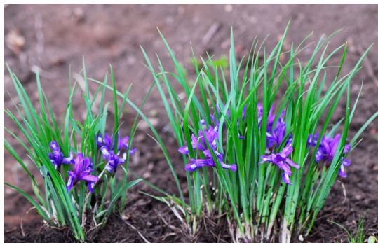
左上：杓兰 左中：长药八宝笑 左下：紫苞鸢尾 右上：莓叶委陵菜 右中：溪荪 右下：绶草