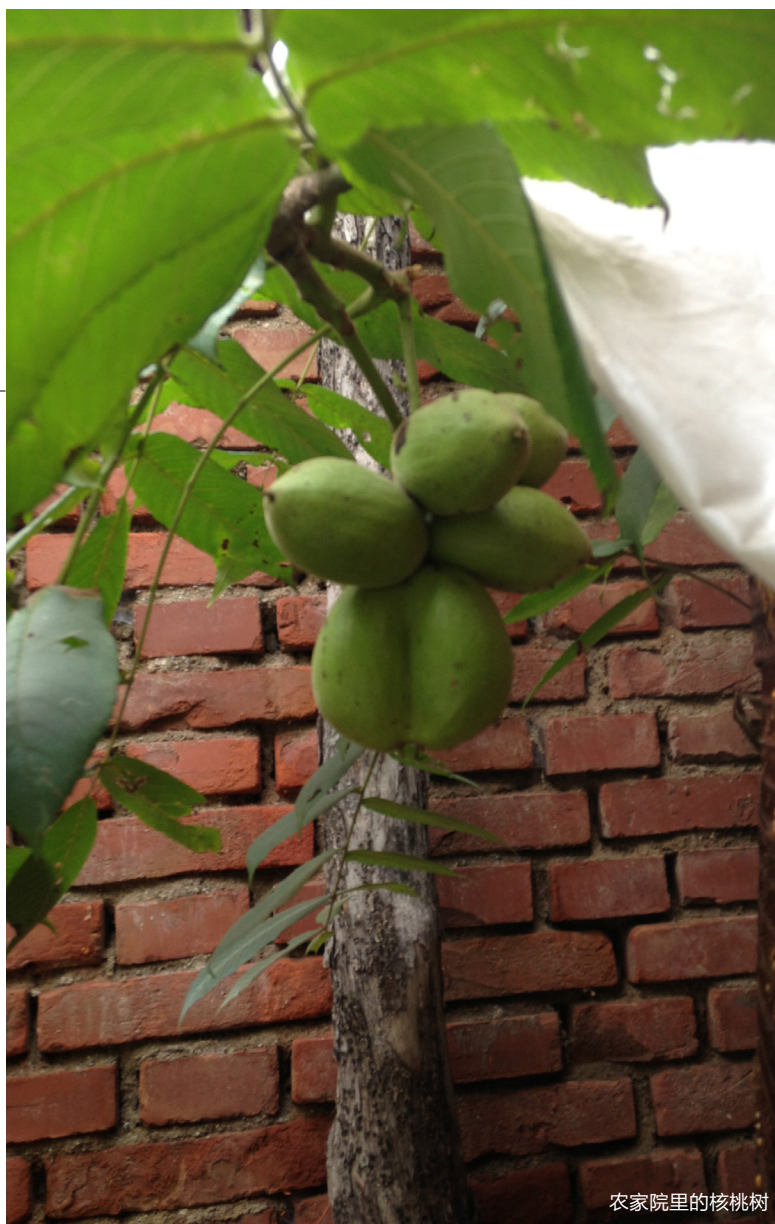
农家院里的核桃树

棵树的产品。由于嫁接技术的发展，已经有嫁接品种的出现（嫁接的也称之为四座楼），但品相还是缺乏老树的韵味，外形与老树还是有一些区别的。今后几年还会有一些嫁接平谷的闷尖狮子头出现。另外平谷的官帽也是很著名的，是传统上的外形标准，由于基本上是野生的，产量不高，个头也不大。市场上还能见到一些平谷产的狮子头，皮质坚硬，纹路好，大肚，大底座，是主要的特征。