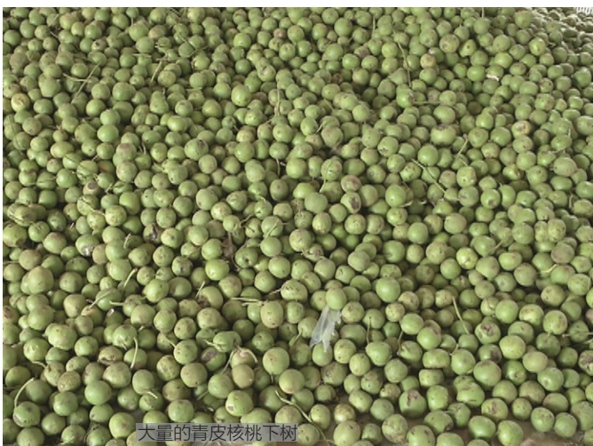
大量的青皮核桃下树