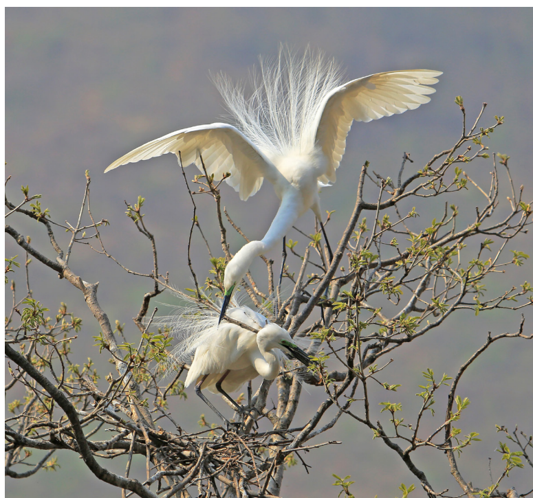
上：白鹭与雏鸟 下：夫妻搭巢