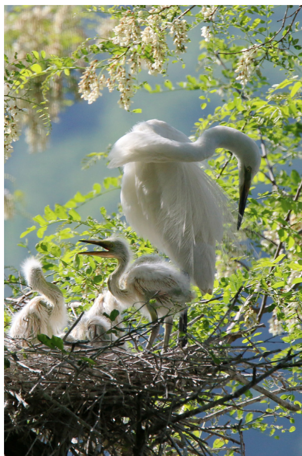
上：巢林一隅 左下：梳妆 右下：槐香中的白鹭