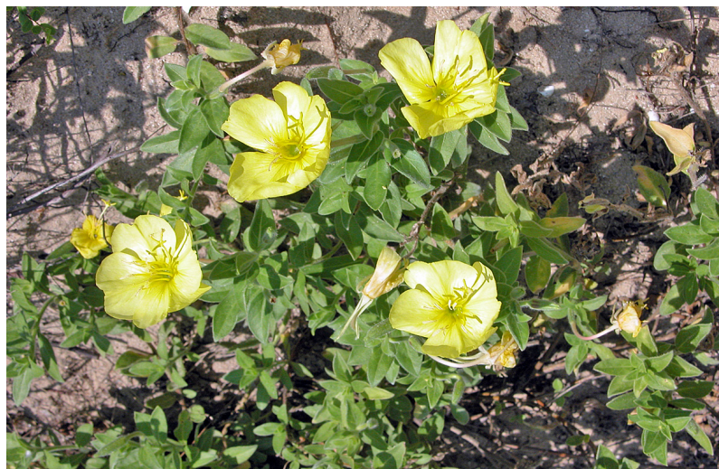
左上：粉花月见草 摄影 / 陈又生 左中：贯月忍冬 摄影 / 李敏 左下：海滨月见草 摄影 / 徐克学 右上：单叶新月蕨 摄影 / 张宪春 右下：三羽新月蕨 摄影 / 张宪春