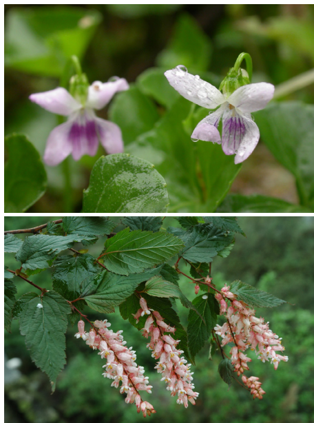
上：如意草 下：中华绣线梅

猫儿山地区共有野生维管束植物1720种，其中蕨类植物132种，裸子植物14种，被子植物1574种。其中，国家一级重点保护野生植物有钟萼木、南方红豆杉、银杏、红豆杉、香果树等5种。观花植物中，仅杜鹃花属就有36种，兰科、山茶科等观赏植物资源十分丰富。