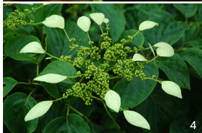
1. 金兰 2. 长蕊杜鹃 3. 铁杉 4. 大叶白纸扇 5. 广西杜鹃 6. 南岭小檗 7. 三棱虾脊兰 8. 黄花鹤顶兰 9. 资源杜鹃