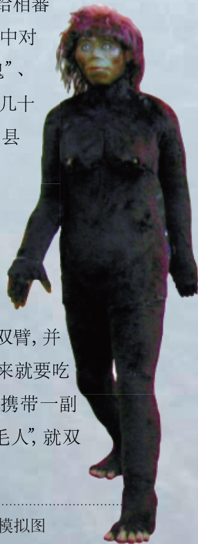
◆ 神农架野人模拟图

广袤无边的森林、千峰万壑的地形给神农架披上了一层神秘的外衣,至今,这里仍有很大一片区域人迹罕至。不少中外科学家都相信,“野人”应该生活在湿度适中、林木茂密、水量充沛且具有立体气候类型的地区。因此,神农架是地球上最有可能有“野人”生存的地区。其实,“野人”的传说在中国可以追溯至很久以前,不仅见于民间的口头流传中,而且在古代文献中也多有记载。如《山海经》中曾描述过这样一种神秘的人形动物:梟阳,其为人,人面,长唇,黑身有毛,反踵,见人笑亦笑。传说周成王时,西南的相蕃国曾有人捉到一只狒狒(古代对“野人”的称呼之一)献给相蕃国王。除“狒狒”外,古书中对“野人”的称呼还有“山鬼”、“毛人”、“黑”、“播”等几十种之多。在神农架当地的县志中也有关于野人的记载,清代文人袁枚曾对此评论说:“传闻有之,未有见之。”比如,当地流传着一种叫“毛人”的野人,据说,它会紧紧抓住人的双臂,并高兴得笑昏过去,待它醒来就要吃人。所以乡民们入山时要携带一副中空的竹筒,万一碰上“毛人”,就双