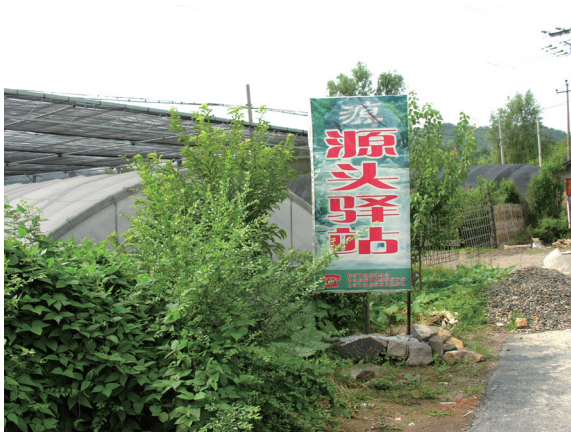
农家旅社与农业生产的无缝结合。

村委会的作用主要体现在引进旅游企业、确保当地社区居民收益，以及加强公共基础设施建设两