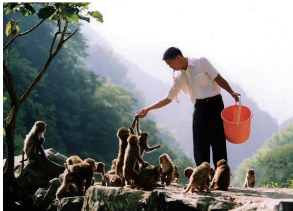
在太湖源生态旅游景区，随处可见人与猴群和睦相处的情景。

太湖源景区建成后，景区企业积极吸纳当地劳动力进入企业，解决了部分当地劳动力的就业问题。此外，在景区门口为居民建设了一个集中销售山货的旅游商品市场，实现野山笋、野生茶、山核桃等农产品向旅游商品的直接转变，减少了中间环节，获得较好的经济收益。