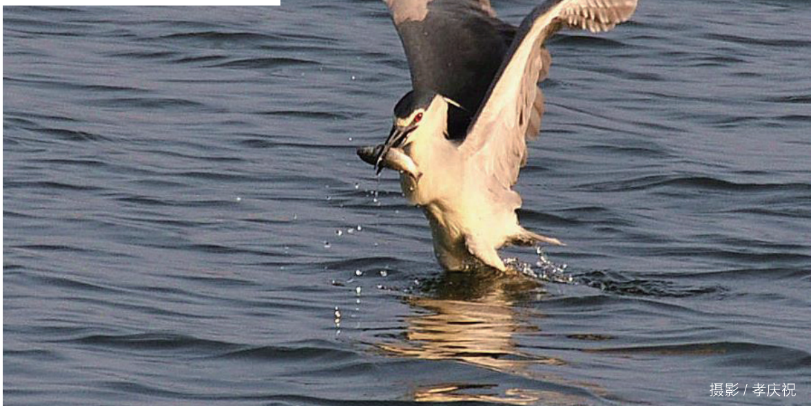
摄影 / 孝庆祝

鹭科夜鹭属，中型涉禽。头顶、虹膜血红色，眼先裸露部黄绿色，后颈、枕、羽冠及背部黑色，枕部具嘴黑色，跗跖和趾黄色。繁殖期为2~3根狭白色冠羽。下体白色。翅及尾羽灰色，腰、两翅和尾羽灰色。繁殖期为4~9月，卵孵化期22~26天，育雏期30~35天。