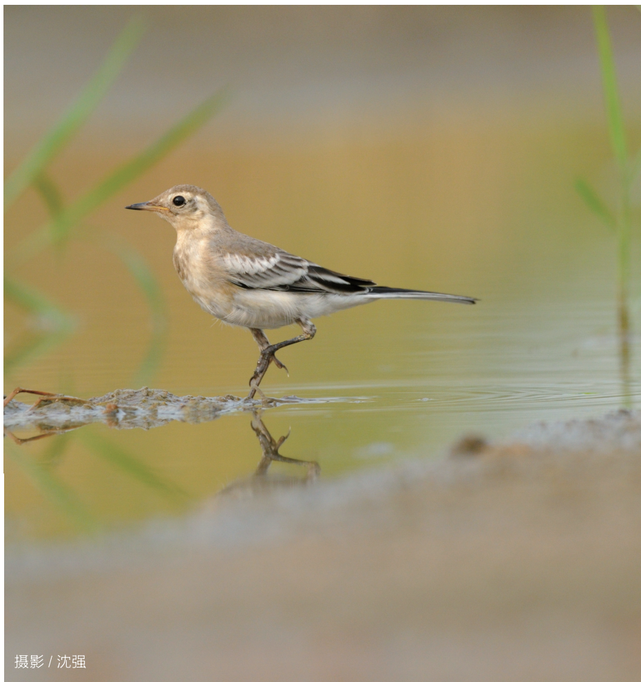
摄影 / 沈强

鹡鸰科鹡鸰属，小型鸣禽。额头顶前部和脸白色，头顶后部、枕和后颈黑色。背、肩黑色或灰色，飞羽黑色。翅上小覆羽灰色或黑色，中覆羽、大覆羽白色或尖端白色，在翅上形成明显的白色翅斑。尾长而窄，尾羽黑色，最外两对尾羽主要为白色。全长约18厘米，翼展约31厘米。繁殖期为3~7月，每窝产卵4~5枚。