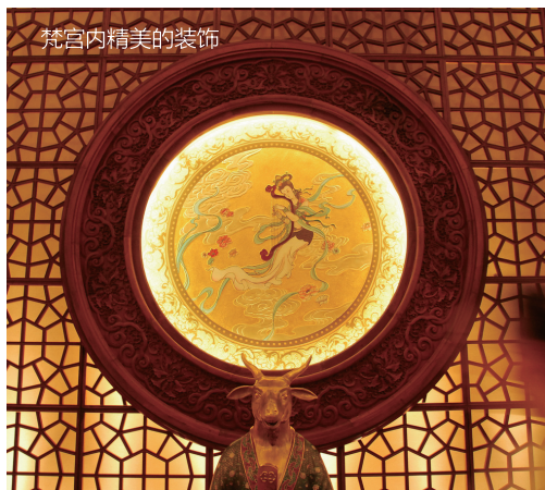
梵宫内精美的装饰