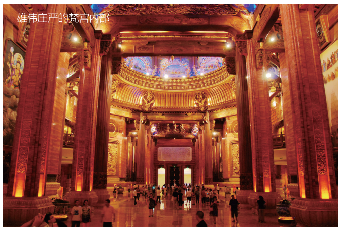
雄伟庄严的梵宫内部