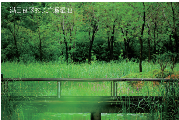
满目苍翠的长广溪湿地

蠡湖原名五里湖，是太湖伸入无锡城区的内湖。“蠡湖”之称源自2500多年前的一段英雄美人的佳话：春秋末期杰出的政治家、