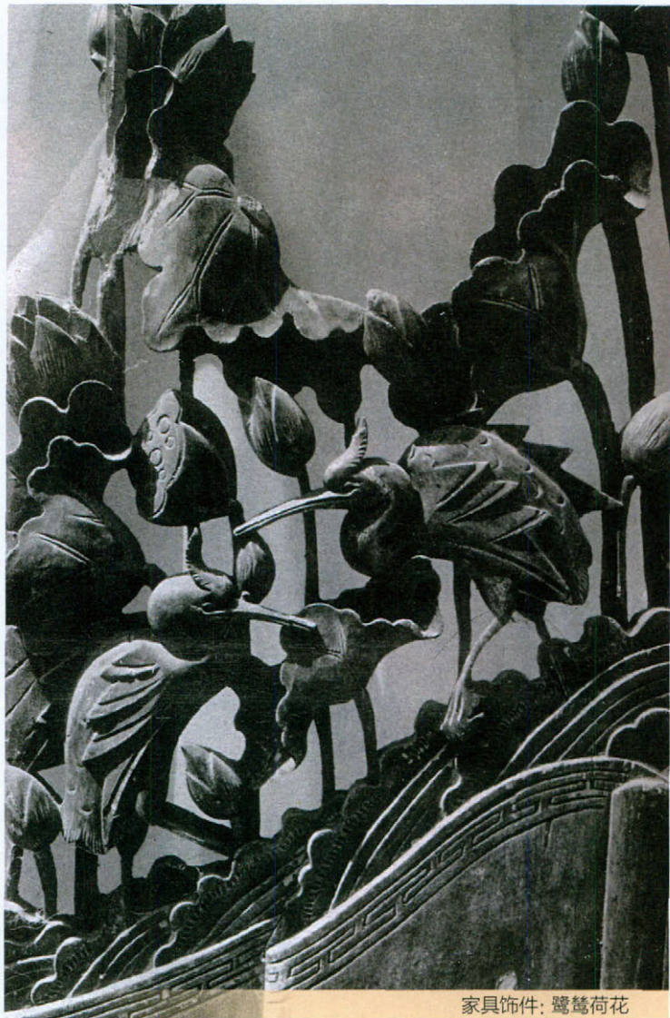
家具饰件：鹭鹭荷花

带的鸟，亦称“火鸡”“珍珠鸟”“吐绶鸟”。因上嘴根有绶，能伸缩，且时时变色，故名。