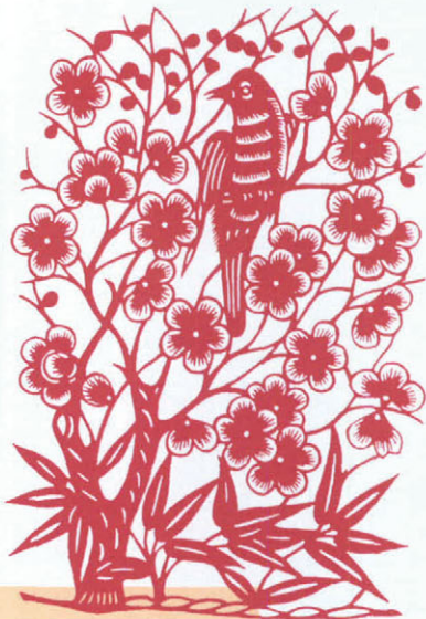
喜上眉梢(河北蔚县)