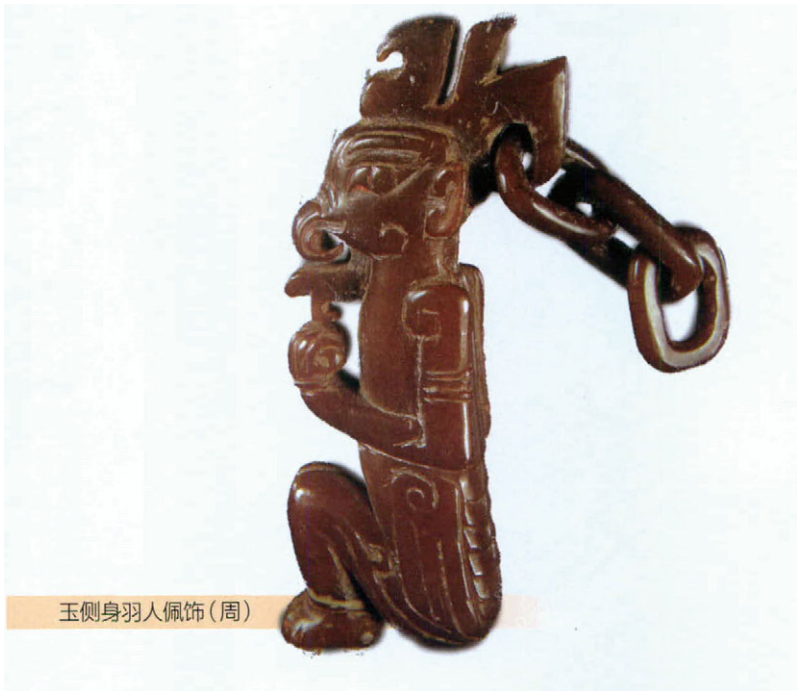
玉侧身羽人佩饰(周)

大的一种原始文化。鸟图腾的文化逐步被上层社会所占有，用来巩固维护上层建筑意识和政权。以玄鸟为图腾的商，更是一个有完善的行政机构的强大奴隶制王国。鸟图腾文化是一种带有浓郁政治色彩的文化。由于这种文化中的商部落，在中原地区建立过强大的王朝，而且这一王朝延续了五百年之久，因此对中国历史与文化产生了极大的影响。