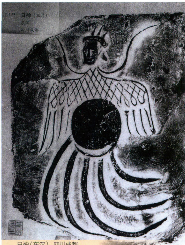
日神(东汉),四川成都