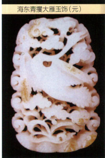
海东青攫大雁玉饰(元)

鸟。此外，不少县、市有清明节蒸面燕的习俗，面燕多用面粉做成，多种多样，有双头燕、母子燕和连体燕等。