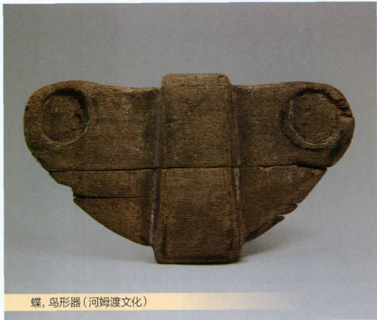
蝶，鸟形器（河姆渡文化）