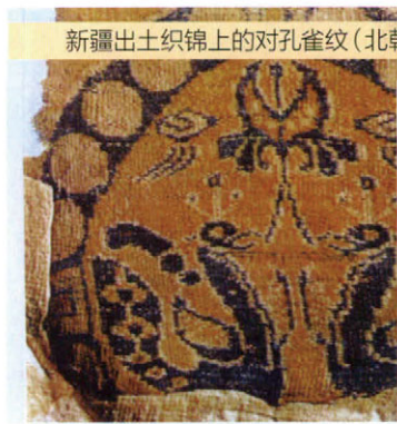
新疆出土织锦上的对孔雀纹(北朝·隋)

除少数民族外，汉族某些地区也有鸟图腾崇拜残余。山东一带为远古少皞部落居住地，古代是以鸟为图腾的。青岛地区的汉族至今流行鸟图腾崇拜的残余形式——供圣鸡、送面燕等古俗。一些县、区在过年和正月十五供圣鸡。所谓圣鸡，即用面粉做成鸡形状，以代表