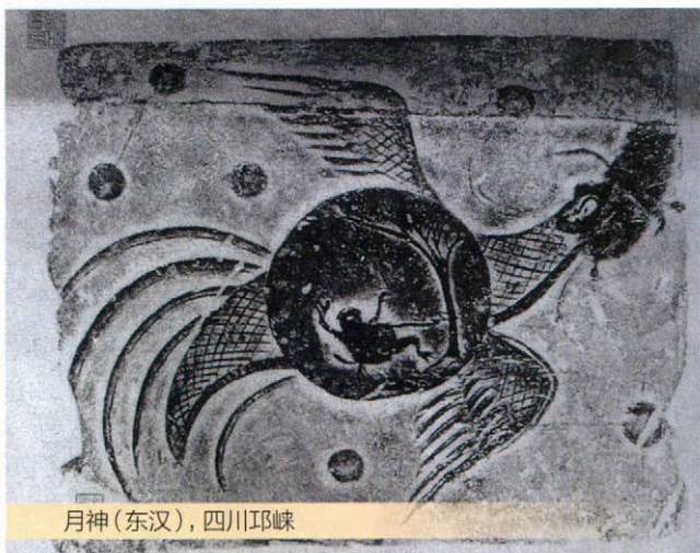
月神(东汉),四川邛崃