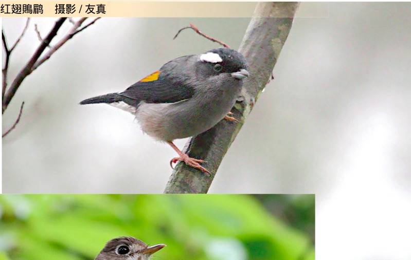
红翅鵙鹛