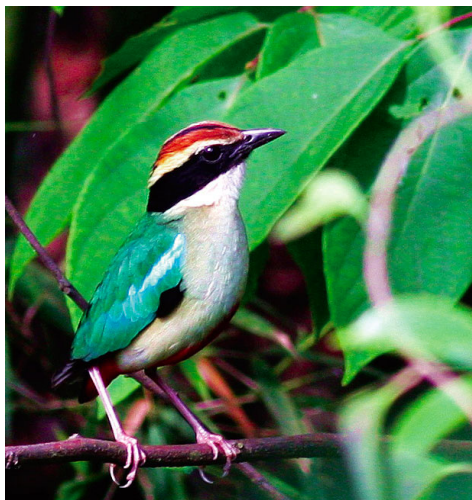
仙八色鸫