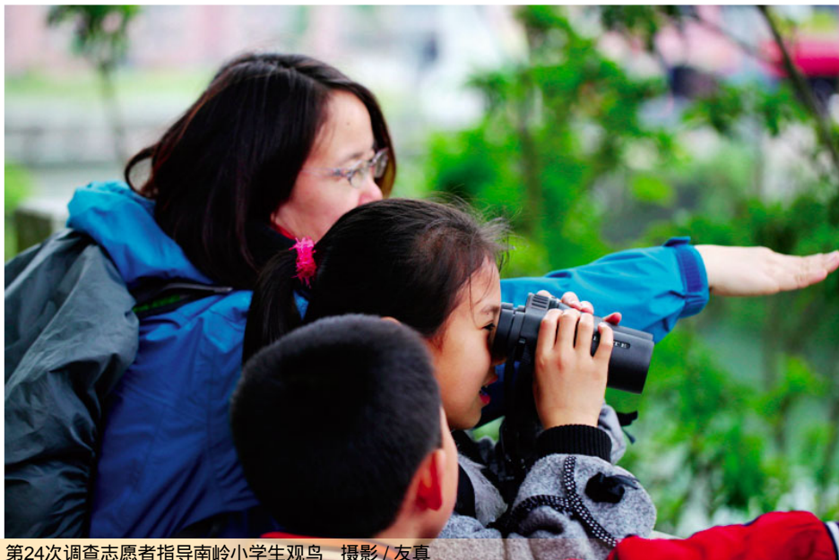
第24次调查志愿者指导南岭小学生观鸟