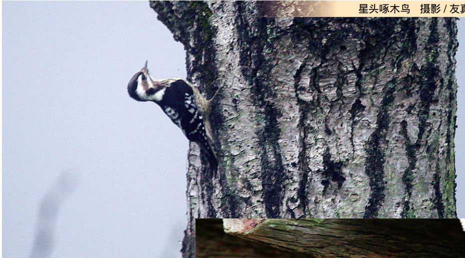
星头啄木鸟