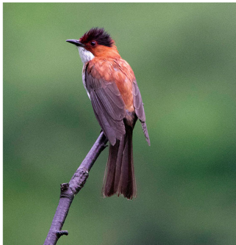
栗背短脚鹛

但客观而言,南岭鸟的种类不少密度却很低,鸟儿又格外怕人,到此观鸟和拍鸟都具有相当的难度。自然保护区本应该成为鸟类自由生活的天堂,但受修路开发、盗猎等多种人为因素及自然灾害的影响,这里的鸟况并不理想。我们更担心旅游开发热起来之后,可能因为游客对野味的需求,人流和车流的大幅增加,导致鸟况进一步恶化。因此在调查后期,我们对当地学生、居民、林业工作者进行了一系列观鸟和生态科普教育,积极地倡导热爱自然、保护鸟类的风气,希望随着人们文明程度和环保意识的普遍提高,将来有一天,南岭自然保护区能成为珍禽随处可见、人鸟和谐共处的世外桃源。