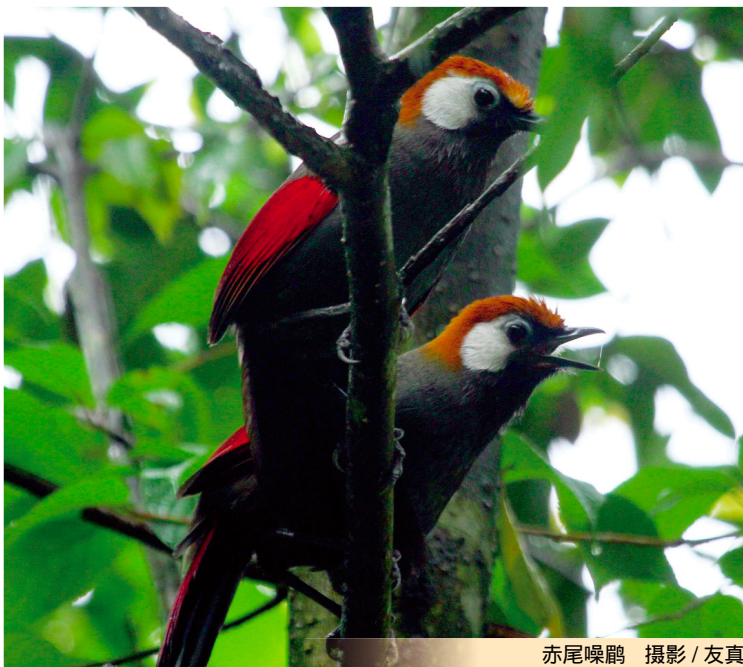
赤尾噪鹛

离开保护站往下走,溪谷对面林子里有群灰喉山椒鸟在飞,紧跟着来了一拨小鸟浪。鸟儿都较小,能见度低,距离又远,望得双眼发酸,才看清有黄颊山雀、大山雀、红头长尾山雀、灰眶雀鹛、金眶鹟莺,还有别的鸟儿无法辨认。鸟儿呵,你总是在我几近绝望时倏然而至,撩拨起希望,却又不知何时能在莽莽林海里再相遇。下到浅山,黄师傅眼尖,发现远处枯枝上有只大鸟,是蛇雕,身姿昂首傲立,以王者之势睥睨着山