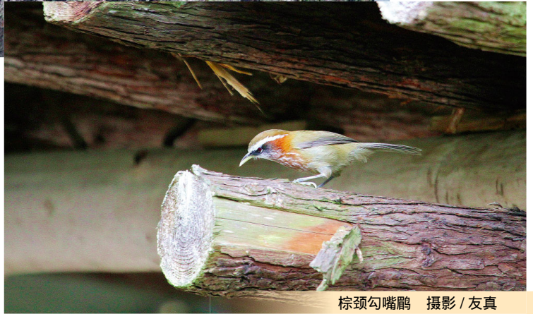
棕颈钩嘴鹛