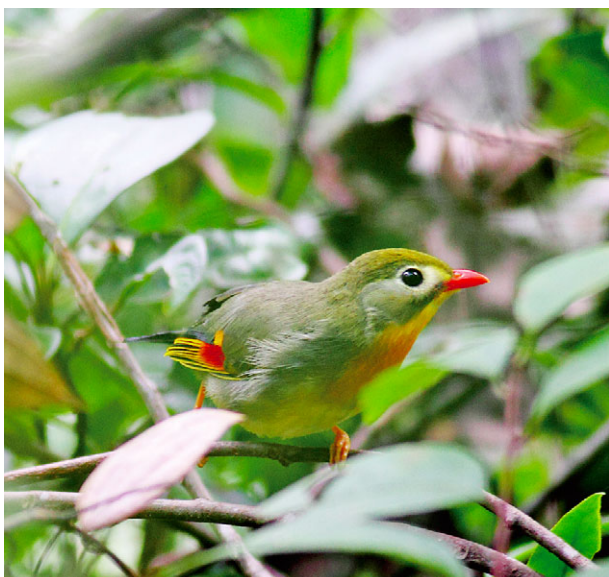
红嘴相思鸟