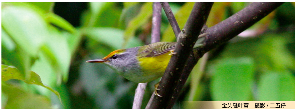
金头缝叶莺