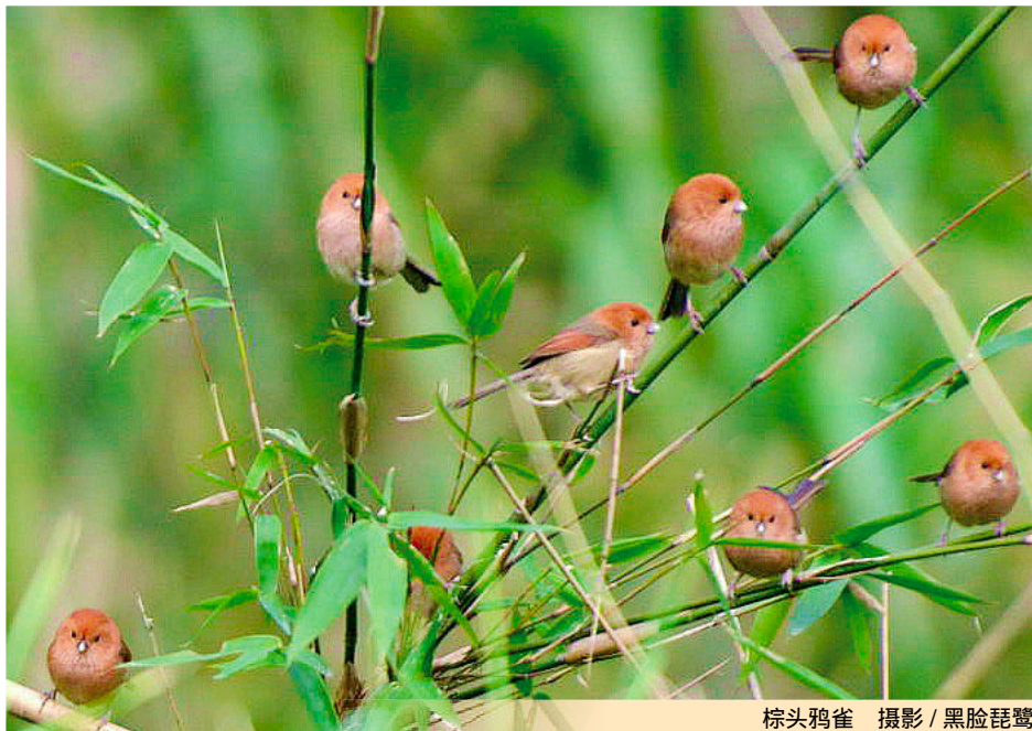
棕头鸦雀 摄影 / 黑脸琵鹭