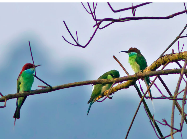
蓝喉蜂虎