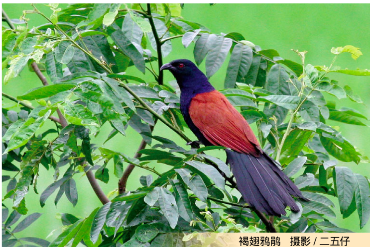
褐翅鸦鹛