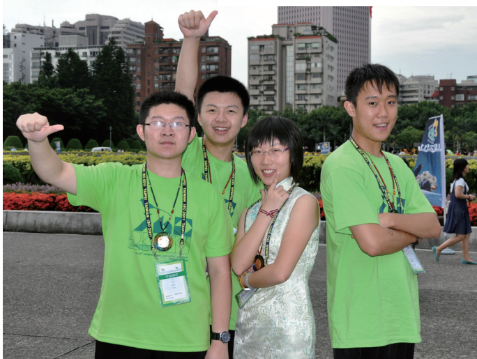
参加第22届国际生物奥林匹克竞赛的我国代表队成员