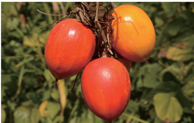
糙点栝楼花型奇特，果大色红艳，极具观赏价值。 图为糙点栝楼果实