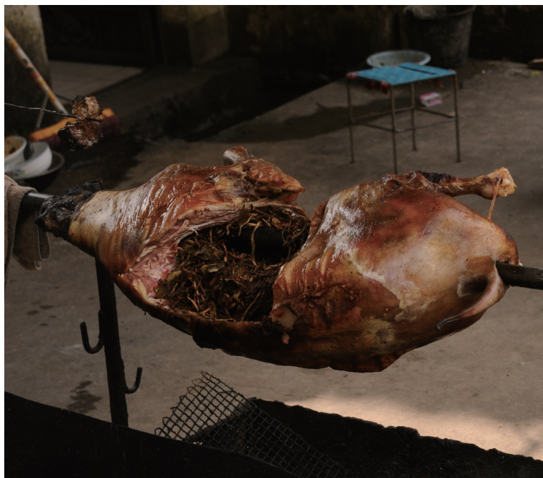
肚子里面塞满各种植物调味料的烤羊