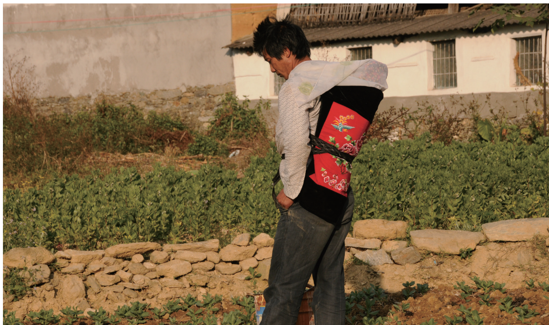
用包袱背孩子下地干活的男人