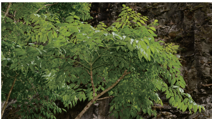
滇菜豆树是有特色的小乔木，树形美丽，作为本地的乡土树种，可用于本地的园林绿化，是一种难得的观叶树种