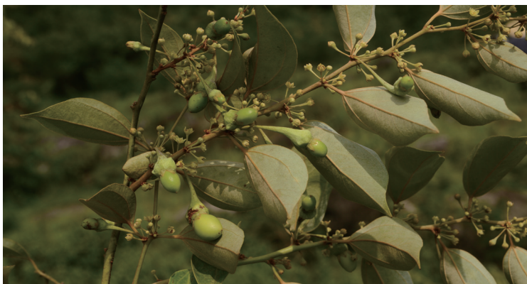
新樟树形美观，果实成熟后鲜红色，具有较高的观赏性，为一种不错的绿化树种。图为新樟未成熟的果实