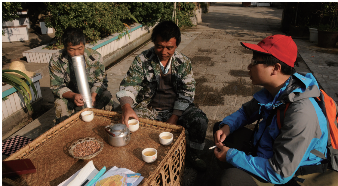
招待客人的茶文化