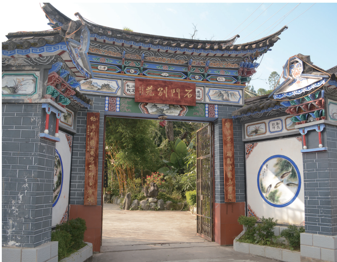
房屋外部均会有各式各样的墙画图案，如鹤、鱼、兰花、竹子等动植物，以及石门关等各类风景图寓意吉祥，富贵，平安