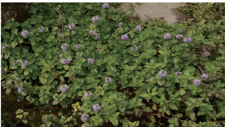
水香薷可作为野菜，可加以培育