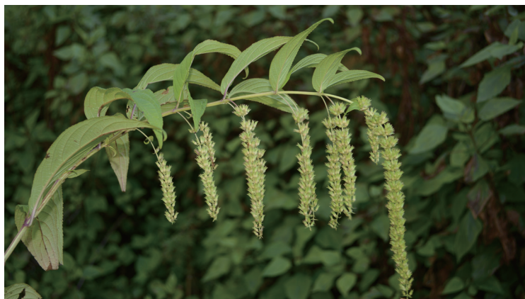
大黄药不仅可以观赏和药用，其种子富含油脂，具有开发利用潜力