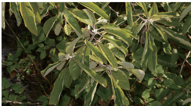
白菊木作为木本的菊科植物（中国菊科植物大都是草本），亦较为特殊，值得重点培育，其他乔木种类亦应该加以保护，有条件也应开展人工繁殖培育