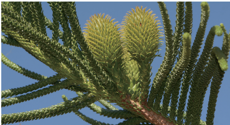
柱冠南洋杉为一外来种，至今国内志书尚有明确记载，而且该树种不仅树形优美，在石门关地区还可正常授粉结实，这在国内引种的南洋杉属植物中并不多见，笔者亦是第一次见到