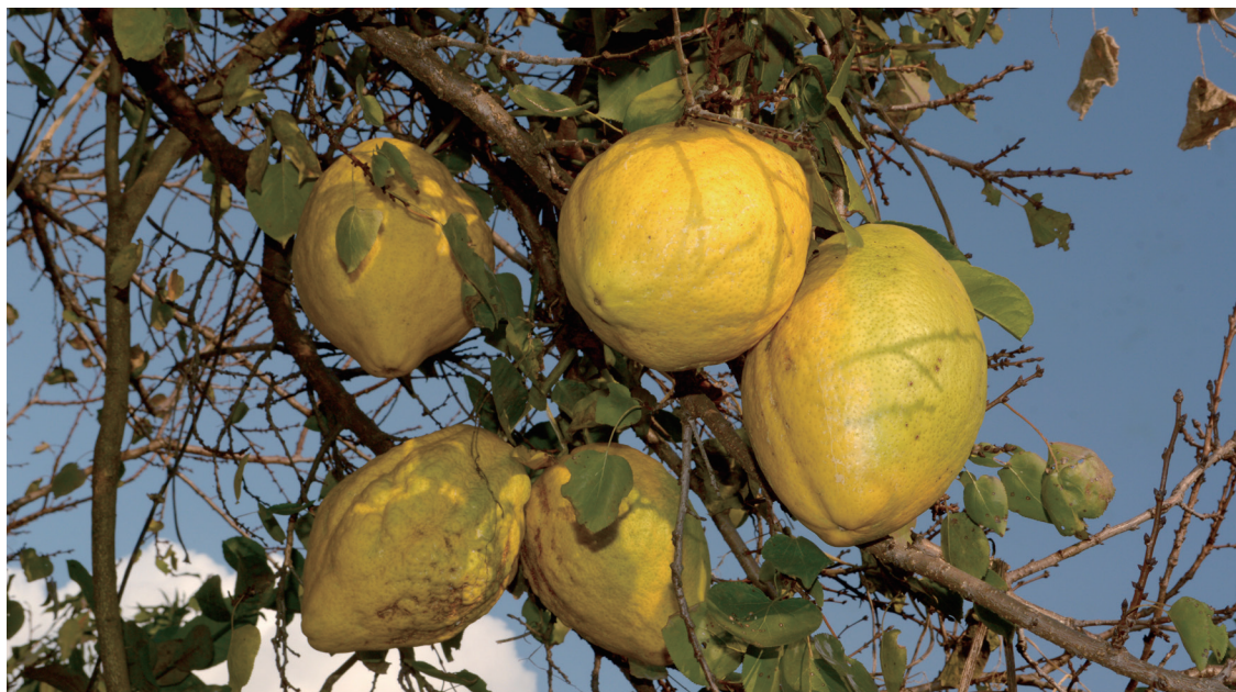
香椽, 个头很大, 品种良好。果实香味四溢, 并且持久。应加以重点培育, 开发前景广阔