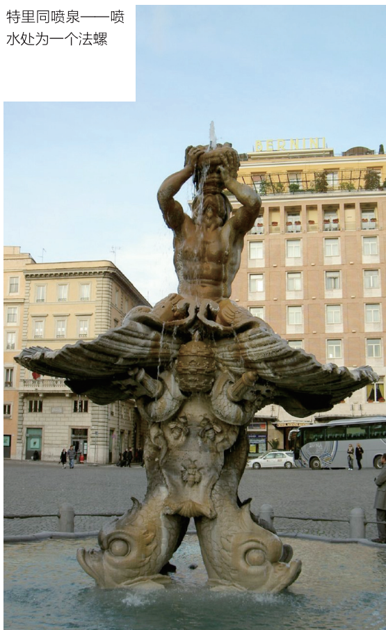
特里同喷泉——喷 水处为一个法螺