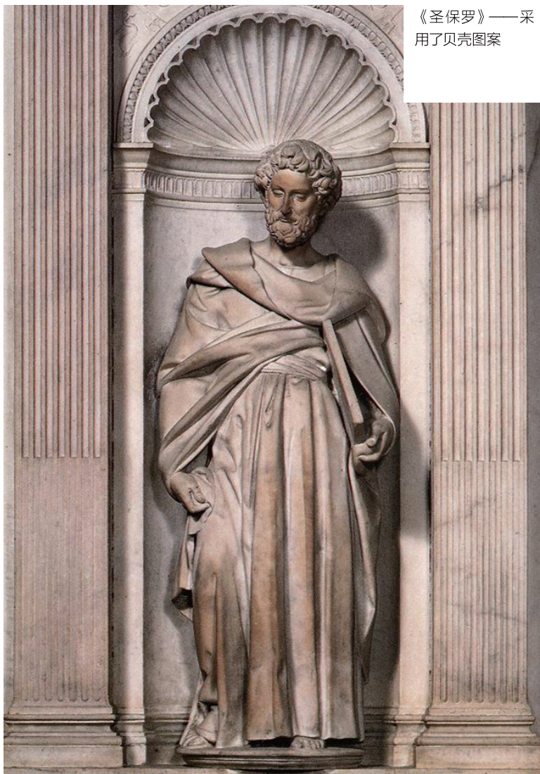
《圣保罗》——采用了贝壳图案