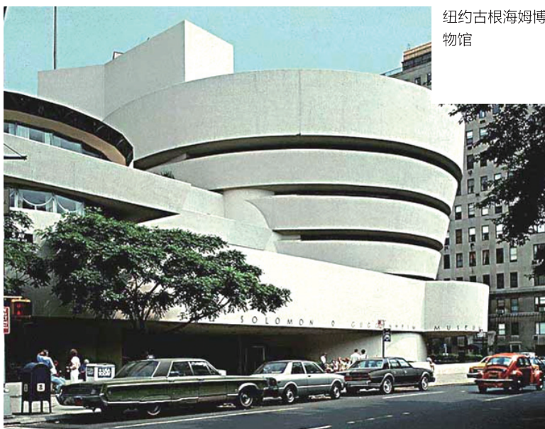
纽约古根海姆博物馆