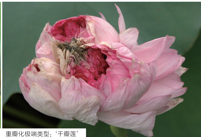
重瓣化极端类型：‘千瓣莲’