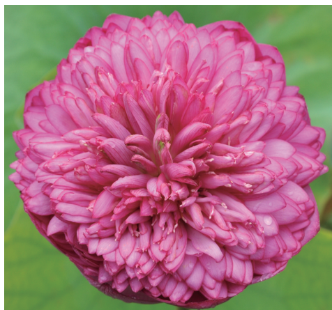
类似‘千瓣莲’的品种：‘至尊千瓣’