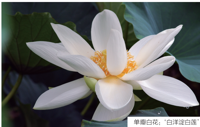
单瓣白花：‘白洋淀白莲’