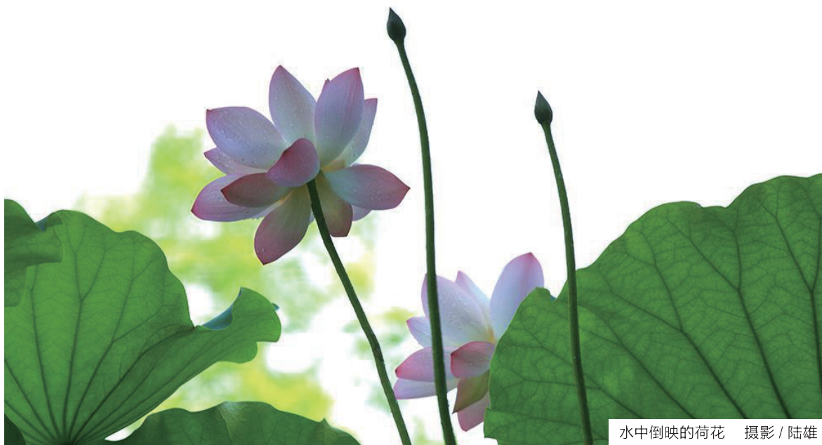
水中倒映的荷花

还需要对大部分栽培品种开展系统科学的评价，制定一个更好分类鉴定操作的标准。尽管如此，野生荷花、原始或传统品种的性状比较稳定，一些现代藕莲品种开花很少，个体通常比较高，这些属于大型荷花。而中型、小型荷花品种主要来源于人工长期的栽培选择结果，有的小型品种立叶很少，失去了原有荷花的一些本来特征。